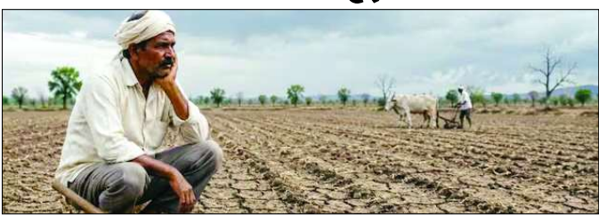
बन रही अनुकूल स्थिति

जयपुर। राजस्थान में प्री-मानसून की बारिश का दौर थमने के बाद पिछले कुछ दिनों से पारा चढ़ा हुआ है। तापमान 40 से 45 डिग्री तक होने के चलते कई जिले भीषण गर्मी की चपेट में हैं। अब मानसून का इंतजार है और प्रदेशवासियों का इंतजार जल्द ही खत्म होने वाला है। मौसम विभाग के मुताबिक, मानसून का काउंटडाउन शुरू हो गया है। पिछले 24 घंटों में प्रतापढ़ के अरुंदो में सर्वाधिक 94 मिमी वर्षा दर्ज की गई। वहीं, अगले 3-4 दिनों तक तेज आंधी के साथ बारिश का दौर जारी रह सकता है, जिसमें हवाओं की गति 50 से 60 किलोमीटर प्रति घंटा तक पहुंचने की संभावना है।