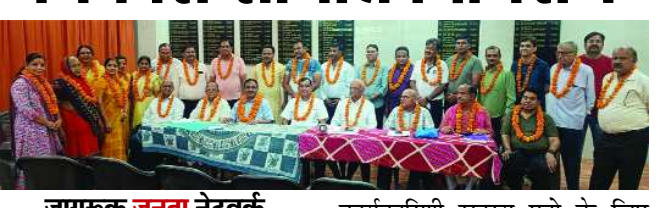
जागरूक जनता नेटवर्क jagrukjanta.net