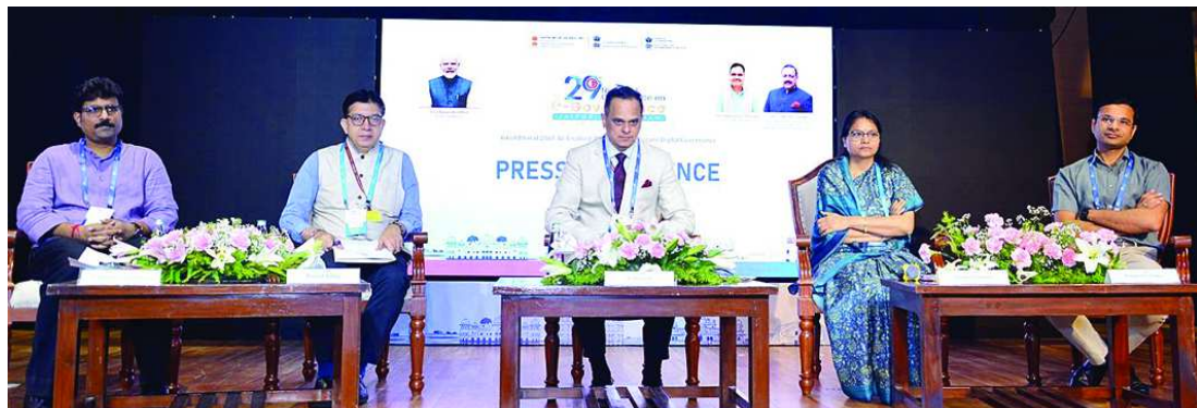
मुख्यमंत्री करेंगे उद्घाटन, जनउपयोगी डिजिटल सेवाओं का होगा लोकार्पण कॉन्फ्रेंस का उद्घाटन बुधवार, 1 जुलाई को मुख्यमंत्री भजनलाल शर्मा करेंगे। इस अवसर पर सूचना प्रौद्योगिकी एवं संचार मंत्री कर्नल राजवर्धन राठोड़ भी उपस्थित रहेंगे। उद्घाटन समारोह के दौरान एनसीईजी प्रदर्शनी का उद्घाटन किया जाएगा तथा प्रदेश की विभिन्न जनउपयोगी डिजिटल सेवाओं का शुभारंभ भी होगा। गुरुवार, 2 जुलाई को समापन एवं पुरस्कार वितरण समारोह में केन्द्रीय विज्ञान एवं प्रौद्योगिकी, पृथ्वी विज्ञान राज्य मंत्री (स्वतंत्र प्रभार) और प्रधानमंत्री कार्यालय, कार्मिक, लोक शिकायत, पेंशन, परमाणु ऊर्जा और अंतरिक्ष राज्य मंत्री डॉ. जितेंद्र सिंह के मुख्य आतिथ्य में राष्ट्रीय ई-गवर्नेंस पुरस्कार-2026 प्रदान किए जाएंगे।

'विकसित भारत 2047, एआई सक्षम, डेटा संचालित एवं सुरक्षित डिजिटल गवर्नेंस' थीम पर होगा दो दिवसीय राष्ट्रीय मंथन दशंबर से 2,700 से अधिक प्रतिनिधि, 200 से अधिक वक्ता, 1100 स्टार्टअप, 400 शिक्षाविद एवं नीति-निर्माता होंगे शामिल जागरूक जनता नेटवर्क jagrukjanta.net