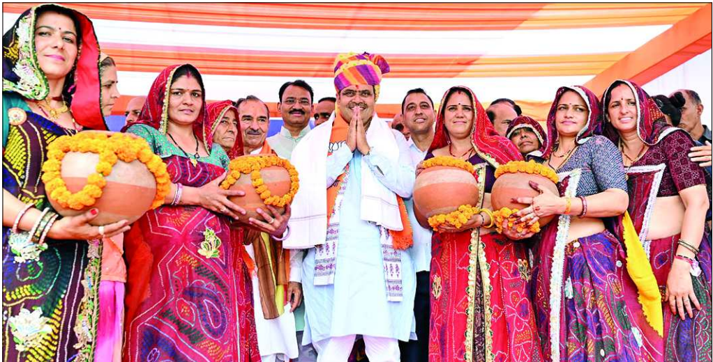
जागरूक जनता नेटवर्क jagrukjanta.net

जयपुर। मुख्यमंत्री भजनलाल शर्मा जयपुर पहुंचे। दिल्ली दौरे से मुख्यमंत्री भजनलाल शर्मा लौटे हैं। सीएम भजनलाल शर्मा ने कहा कि राजस्थान-हरियाणा के बीच ऐतिहासिक यमुना जल समझौता हुआ। दिल्ली से लौटने पर मुख्यमंत्री भजनलाल शर्मा का भव्य स्वागत हो रहा है। मुख्यमंत्री भजनलाल शर्मा रामबाग सर्किल पहुंचे। मुख्यमंत्री भजनलाल शर्मा ने अपने संबोधन में कहा कि शेखावाटी के लोगों की मेहनत और ताकत को मैं जानता हूँ। आने वाले समय में शेखावाटी में पानी की कमी नहीं रहेगी। शेखावाटी की धरती सोना उगलेगी। शेखावाटी को जल्द ही पानी मिलेगा। कांग्रेस ने कभी इस मुद्दे को हल नहीं किया। वादे करके