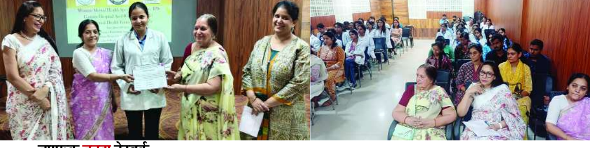
जागरूक जनता नेटवर्क jagrukjanta.net

जयपुर। वूमन मेंटल हेल्थ स्पेशलिटी सेक्शन, इंडियन साइकाइट्रिक समिति (IPS), गौतम हॉस्पिटल एंड रिसर्च सेंटर एवं मेंटल हेल्थ फाउंडेशन जयपुर के संयुक्त तत्वाधान से 24 जून को गौतम अस्पताल के सभागार में महिला मानसिक स्वास्थ्य विषय पर वाद विवाद प्रतियोगिता का आयोजन किया गया। प्रतियोगिता में विभिन्न विश्वविद्यालयों, एमटी यूनिवर्सिटी, आई आई एस यूनिवर्सिटी, अपेक्स यूनिवर्सिटी के