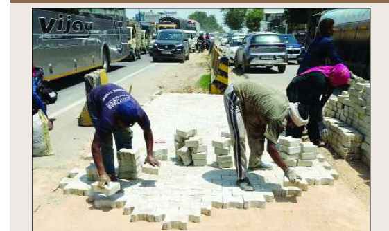
जागरूक जनता नेटवर्क jagrukjanta.net

चरणबद्ध रूप से सुधार कार्य होंगे सुनिश्चित