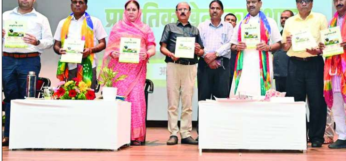
जयपुर/कोटा। लोकसभा अध्यक्ष ओम बिरला के मार्गदर्शन एवं निर्देशों की पालना में कोटा में प्राकृतिक खेती विषयक भव्य किसान कार्यशाला का आयोजन किया गया। आयोजित कार्यशाला में लगभग एक हजार किसानों ने भाग लेकर प्राकृतिक खेती, कम लागत में उच्च गुणवत्ता वाली खेती, बेहतर उत्पादन, कृषि विपणन, पशुपालन तथा उद्यमिकी के माध्यम से आय बढ़ाने को आधुनिक तकनीकों की जानकारी प्राप्त की। इस अवसर पर प्राकृतिक खेती पर आधारित पुस्तक का विमोचन किया गया तथा कृषि क्षेत्र में उत्कृष्ट कार्य करने वाले किसानों का सम्मान भी किया गया।