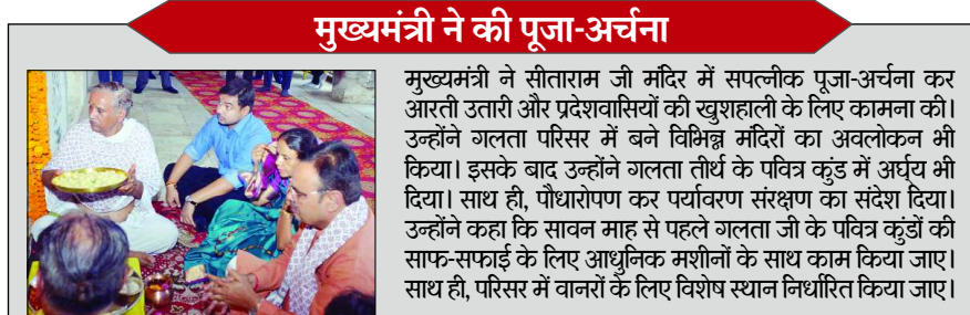
मुख्यमंत्री ने की पूजा-अर्चना

मुख्यमंत्री ने सीताराम जी मंदिर में सप्लीक पूजा-अर्चना कर आरती उतारी और प्रदेशवासियों की खुशहाली के लिए कामना की। उन्होंने गलता परिसर में बने विभिन्न मंदिरों का अवलोकन भी किया। इसके बाद उन्होंने गलता तीर्थ के पवित्र कुंड में अर्घ्य भी दिया। साथ ही, पोधारोपण कर पर्यावरण संरक्षण का संदेश दिया। उन्होंने कहा कि सावन माह से पहले गलता जी के पवित्र कुंडों की साफ-सफाई के लिए आधुनिक मशीनों के साथ काम किया जाए। साथ ही, परिसर में वानरों के लिए विशेष स्थान निर्धारित किया जाए।