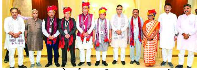
जागरूक जनता नेटवर्क jagrukjanta.net