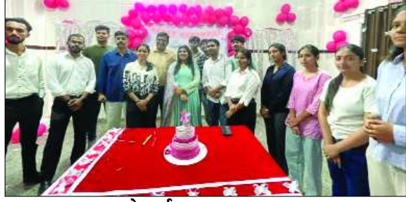
जागरूक जनता नेटवर्क jagrukjanta.net

सभागार एवं डिजिटल म्यूजियम का अवलोकन- उद्घाटन कार्यक्रम के पश्चात् समाप्त अतिथिगणों ने राजस्थान विधानसभा के सभागार का अवलोकन किया तथा विधानसभा की गरिमामयी संसदीय परम्पराओं एवं ऐतिहासिक विरासत से परिचय प्राप्त किया। इसके साथ ही अतिथिगणों ने विधानसभा परिसर में स्थापित अत्याधुनिक डिजिटल म्यूजियम का भी अवलोकन किया। यह डिजिटल म्यूजियम राजस्थान की विधायी यात्रा, संसदीय इतिहास एवं लोकतांत्रिक परम्पराओं को अत्याधुनिक तकनीक के माध्यम से जीवंत रूप में प्रस्तुत करता है। अतिथिगणों ने इसे अत्यंत ज्ञानवर्धक एवं प्रेरणादायक बताया। विजिटर्स बुक में अंकित हुई सराहना- उद्घाटन के अवसर पर आये पांच राज्यों में विधान सभा अध्यक्षगण ने विजिटर्स बुक में अपने अनुभव एवं प्रशंसनीय सुझाव अंकित किए। अतिथियों ने हर्बल वाटिका, नक्षत्र वाटिका एवं डिजिटल म्यूजियम को राजस्थान विधानसभा की विशिष्ट एवं प्रेरणादायक उपलब्धि निरूपित किया तथा इसे भारतीय ज्ञान परम्परा, पर्यावरण संरक्षण एवं लोकतांत्रिक विरासत के संरक्षण की दिशा में उल्लेखनीय योगदान बताया।