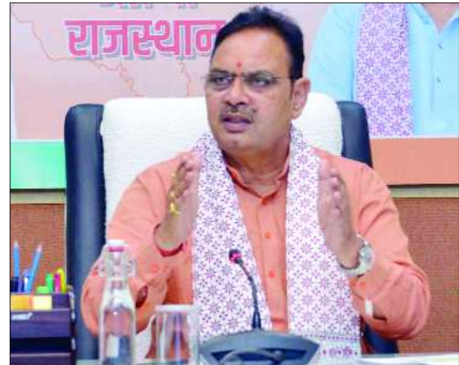
किसानों को फलदार पौधे उपलब्ध करवाएगी राज्य सरकार

शर्मा ने कहा कि पर्यावरण संरक्षण के साथ-साथ किसानों की आय में वृद्धि के लिए राज्य सरकार किसानों को फलदार पौधे उपलब्ध करवाएगी। ऐसे में वन विभाग फलदार पौधों के वितरण की भी योजना बनाए। उन्होंने पहाड़ी एवं वन क्षेत्रों में ड्रोन सीडिंग एवं अरावली क्षेत्र में सघन वृक्षारोपण के भी निर्देश दिए।