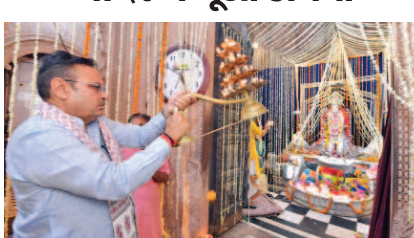
जागरूक जनता नेटवर्क jagrukjanta.net