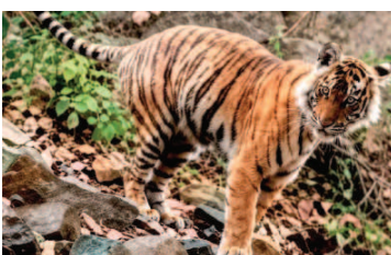
उपवन संरक्षक ने दी जानकारी

सवाईमाधोपुर। रणथम्भौर टाइगर रिजर्व में बाघ और अन्य वन्यजीवों के साथ मानव संघर्ष तथा आपातकालीन स्थितियों से निपटने के लिए जल्द ही वनकर्मियों और होमगार्ड को खबर गन उपलब्ध कराने की कवायद की जा रही है। राज्य सरकार ने पूर्व में बजट में वनकर्मियों की सुरक्षा को ध्यान में रखते हुए जंगल में ट्रेकिंग, गश्त और पेट्रोलिंग करने वाले कर्मचारियों को बंदूकें उपलब्ध कराने की घोषणा की थी। इसी क्रम में करीब सवा साल पहले रणथम्भौर के तत्कालीन सीसीएफ की ओर से उच्चाधिकारियों को खबर गन उपलब्ध कराने का प्रस्ताव भेजा गया था।