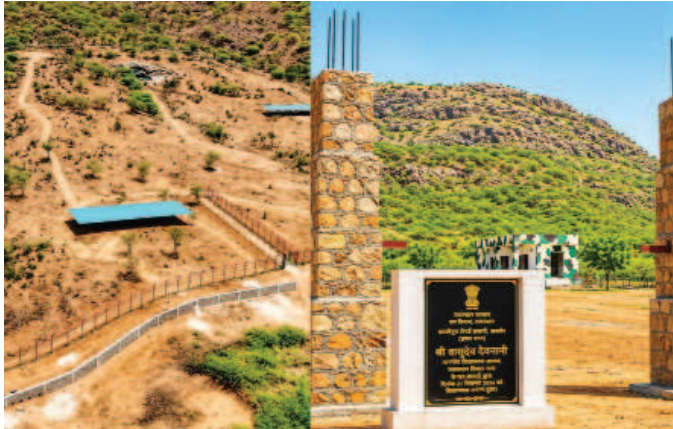
यह हो रहे हैं निर्माण

अजमेर। काजीपुरा में अजमेर संभाग की पहली लेपर्ड सफारी तैयार हो रही है। लोहे की फेंसिंग, टिकट विंडो, चौकी सहित चारदीवारी का 80 प्रतिशत काम हो चुका है। जल्द यहाँ जिप्सी चलाने की योजना है। इससे पर्यटकों को सैर-सपाटे का मौका मिलेगा। राज्य सरकार की बजट घोषणा अनुसार विधानसभा अध्यक्ष वासुदेव देवनांनी ने बीते वर्ष सितम्बर में इसका शिलान्यास किया था। वन विभाग की अगुवाई में पहले चरण में 5.5 करोड़ रुपये से कार्य प्रारंभ हो चुका है। इससे 24 किलोमीटर क्षेत्र में इको टूरिज्म बढ़ेगा। प्रे-बेस के लिए 1.50 करोड़ और सफारी के लिए 20 करोड़ रुपये खर्च होंगे। जल्द ही वन्यजीव सफारी में लेपर्ड का दीदार कर सकेंगे।