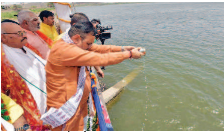
जागरूक जनता नेटवर्क jagrukjanta.net

जयपुर। मुख्यमंत्री भजनलाल शर्मा ने 'वंदे गंगा जल संरक्षण जन अभियान-2026' के पहले दिन सोमवार को गंगादशमी के पावन अवसर पर भरतपुर स्थित बंध बरेठा बांध पर विधिवत् एवं वैदिक मंत्रोच्चार के साथ जल पूजन किया। इस अवसर पर मुख्यमंत्री ने प्रदेशवासियों से जल संरक्षण को जनभागीदारी का अभियान बनाने का आह्वान करते हुए कहा कि जल ही जीवन का आधार है और आने वाली पीढ़ियों के सुरक्षित भविष्य के लिए जल संसाधनों का संरक्षण अत्यंत आवश्यक है।