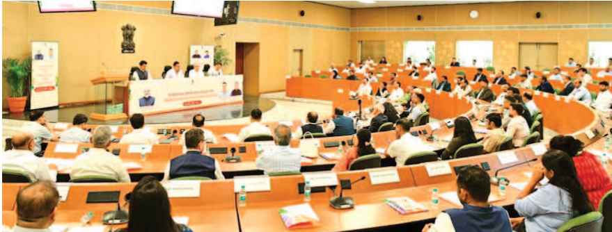
जागरूक जनता नेटवर्क jagrukjanta.net

जयपुर। केन्द्रीय इलेक्ट्रॉनिक्स एवं सूचना प्रौद्योगिकी मंत्री अश्विनी वैष्णव ने कहा कि इलेक्ट्रॉनिक्स मैनुफैक्चरिंग क्षेत्र में राजस्थान के लिए बड़ा हिस्सेदार बनने की अपार संभावनाएं हैं। प्रधानमंत्री नरेंद्र मोदी के नेतृत्व में देश इस क्षेत्र में निरन्तर तेजी से आगे बढ़ रहा है और गत दो वर्षों में 450 फैक्ट्रियों की स्थापना का मार्ग प्रशस्त हुआ है। वहीं, इलेक्ट्रॉनिक कम्पोंनेट मैनुफैक्चरिंग स्कीम (ईसीएमएस) के तहत एक साल में 75 फैक्ट्रियां स्वीकृत हो चुकी हैं। साथ ही, इस योजना को लेकर केन्द्रीय कैबिनेट ने बजट को भी बढ़ाया है।