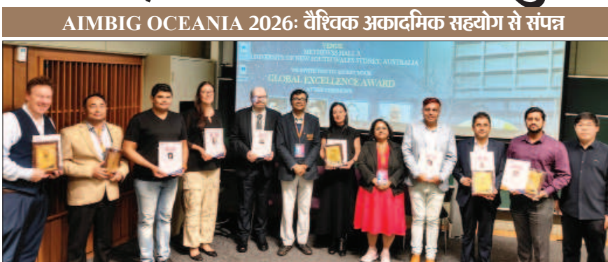
AIMBIG OCEANIA 2026: वैश्विक अकादमिक सहयोग से संपन्न