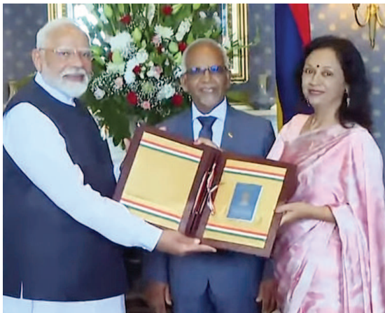
राष्ट्रपति गोखूल ने पीएम मोदी के सम्मान में राजकीय भोज का आयोजन