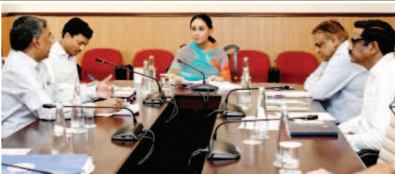
सर्वे में प्रथम रहे हैं, क्रियान्वयन में भी शीर्ष पर रहे

जयपुर। प्रधानमंत्री ग्राम सड़क योजना के चतुर्थ चरण के तहत प्रदेश की लगभग 1630 बसावटों को पक्की सड़कों से जोड़ा जाएगा। उप मुख्यमंत्री दीया कुमारी ने बताया कि अनुमानित 3 हजार 500 करोड़ की लागत से लगभग 5 हजार किमी पक्की सड़कों का निर्माण करवाकर दूरदराज के गांवों, ढाणियों/बसावटों को सर्वकालिक सड़कों से जोड़ा जाएगा। उप मुख्यमंत्री ने उप मुख्यमंत्री कार्यालय में सार्वजनिक निर्माण विभाग के अन्तर्गत स्थापित राजस्थान ग्रामीण सड़क विकास प्राधिकरण की बैठक की अध्यक्षता करते हुए कहा कि प्रदेश की सभी बसावटों को सर्वकालिक पक्की सड़कों से जोड़ना हमारी पहली प्राथमिकता है। इससे न केवल परिवहन सुगम एवं तीव्र होगा बल्कि आर्थिक विकास के भी नये द्वार खुलेंगे। गौरतलब है कि उप मुख्यमंत्री के नेतृत्व में सार्वजनिक निर्माण विभाग द्वारा प्रधानमंत्री ग्राम सड़क योजना के चतुर्थ चरण के अन्तर्गत प्रदेश की 1630 ग्रामीण बसावटों में सड़कों हेतु सर्वे का कार्य 31 जनवरी 2025 से पूर्व ही करवाया जा चुका है। देश में राजस्थान द्वारा यह सर्वे सबसे पहले पूरा करवाया गया है। इसके तहत 1374 मरुस्थलीय, जनजातीय एवं आशान्वित जिला/ब्लॉक कार्यक्रम अन्तर्गत चिह्नित बसावटों, 500 से 999 आबादी की 191 बसावटों, 1000 एवं उससे अधिक की 30 बसावटों तथा धरती आभा-जनजातीय ग्राम उत्कर्ष अभियान के अन्तर्गत 35 बसावटों को सर्वकालिक