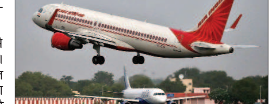
वर्तमान में संचालित विमान सेवा

अजमेर। 1 मार्च से किशनगढ़ से अहमदाबाद के लिए हवाई सेवा शुरू होगी। डीजीसीए ने इंडिगो एयरलाइंस को अनुमति दी। जल्द ही टाइम शेड्यूल जारी किया जाएगा। इसके साथ ही एक मसौदा बात है कि मार्वल एंटीसिएशन प्रत्येक यात्री को एक हजार रुपए की प्रोत्साहन राशि देगा। इंडिगो एयरलाइंस ने एयरपोर्ट पर अपने ऑफिस आदि को लेकर सोमवार से कवायद शुरू कर दी। अभी तक किशनगढ़ से हिन्दन (दिल्ली), नागपुर, पुना, हैदराबाद और लखनऊ की हवाई सेवा है।