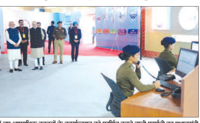
चंडीगढ़ में नए आपराधिक कानूनों के कार्यान्वयन को प्रदर्शित करने वाली प्रदर्शनी का प्रधानमंत्री नरेंद्र मोदी, गृहमंत्री अमित शाह ने निरीक्षण किया।

चंडीगढ़। प्रधानमंत्री नरेंद्र मोदी एक कार्यक्रम में चंडीगढ़ पहुंचे। चंडीगढ़ पुलिस की ओर से तीन नए आपराधिक कानूनों को लेकर प्रदर्शनी आयोजित की गई। इसी कार्यक्रम में पीएम मोदी और गृह मंत्री अमित शाह ने हिस्सा लिया। चंडीगढ़ एम-सेण्ड नीति-2024 का हाल ही में राज्य मंत्रिमंडल की बैठक में अनुमोदन किया गया था। प्रदेश की आर्थिक प्रगति, रोजगार सृजन और सामाजिक समृद्धि सुनिश्चित करने के लिए तैयार की गई ये नीतियां राइजिंग राजस्थान ग्लोबल इन्वेस्टमेंट समिट में आने वाले निवेश के परिपक्व होने का मजबूत आधार बनेंगी।