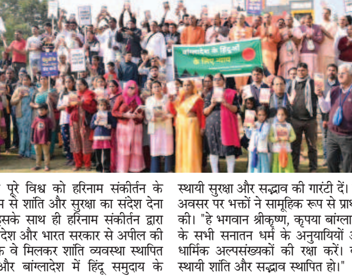
उद्देश्य पूरे विश्व को हरिनाम संकीर्तन के माध्यम से शांति और सुरक्षा का संदेश देना था। इसके साथ ही हरिनाम संकीर्तन द्वारा बांग्लादेश और भारत सरकार से अपील की गई कि वे मिलकर शांति व्यवस्था स्थापित करें और बांग्लादेश में हिंदू समुदाय के