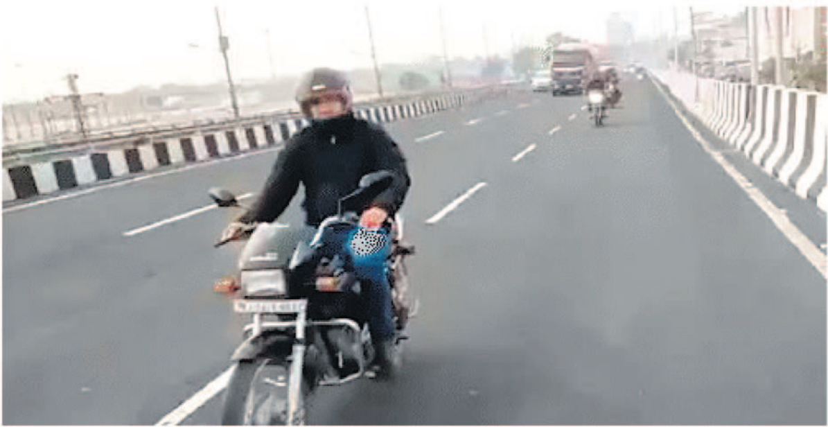
लोकल स्पॉट की लिस्ट लिस्टेड थे

जयपुर। जयपुर-किशनगढ़ एक्सप्रेस-वे पर कमला नेहरू नगर पुलिया के पास बने फ्लाईओवर को सोमवार से शुरू कर दिया गया। इस पुलिया के पास हमेशा लगने वाले जाम से अब लोगों को राहत मिलेगी। वहीं कमला नेहरू नगर और उससे लगती एक दर्जन से ज्यादा कॉलोनी के करीब 25 हजार से ज्यादा लोगों को इसका सबसे ज्यादा फायदा होगा। वहीं अजमेर की तरफ से आने वाले वाहन चालकों का समय भी बचेगा। फ्लाईओवर के शुरू होने के बाद अब सर्विस लेन खाली हो गई और अब ट्रेफिक का मूवमेंट आसान हो गया। एनएचआई अधिकारियों के मुताबिक 600 मीटर लंबे तीन लेन के इस फ्लाईओवर को बनाने में करीब 8.34 करोड़ रुपये का खर्चा आया।