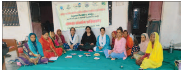
जागरूक जनता नेटवर्क jagrukjanta.net