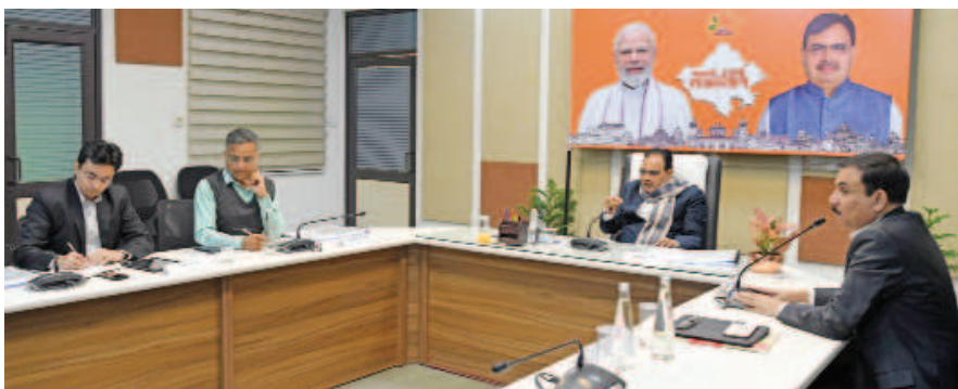
सभी आवश्यक सुविधाएं विकसित होगी यूनिटी मॉल में

जयपुर। मुख्यमंत्री भजनलाल शर्मा ने कहा कि राजस्थान मंडपम राज्य की कला, संस्कृति और परंपरा को बढ़ावा देने के लिए सांस्कृतिक और व्यावसायिक आयोजनों के लिए प्रमुख आकर्षण का केंद्र बनेगा। उन्होंने अधिकारियों को निर्देश दिए कि जयपुर में बनने वाले इस मंडपम को विश्वस्तरीय सुविधाओं से लैस बनाया जाए तथा इसमें आधुनिक तकनीक और परंपरागत राजस्थानी वास्तुकला का बेहतरीन संयोजन किया जाए। उन्होंने अधिकारियों को मंडपम के निर्माण को समय पर पूरा करने के निर्देश दिए। शर्मा मुख्यमंत्री निवास पर राजस्थान मंडपम के निर्माण की तैयारियों को लेकर बैठक को संबोधित कर रहे थे। उन्होंने कहा कि भारत मंडपम की तर्ज पर जयपुर में राजस्थान मंडपम का निर्माण किया जाएगा। उन्होंने अधिकारियों को निर्देश दिए कि इसमें बनने वाले एजीबिशन हॉल, ओपन हॉल तथा ऑडिटोरियम में दर्शक क्षमता का पूरा ध्यान रखा जाए जिससे ज्यादा से ज्यादा लोग यहां आयोजित होने वाले कार्यक्रमों में भागीदारी कर