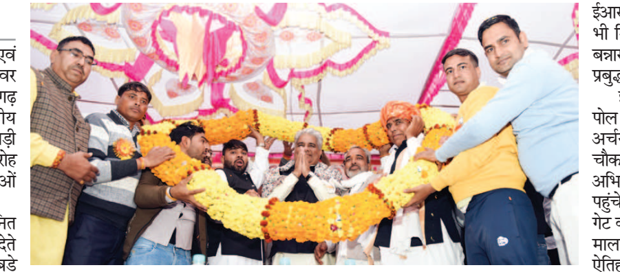
बाद जब पहली बार बड़ेगा गांव में आए तो वहां के लोगों ने कहा कि काफ़ी वर्षों से यह केंद्रीय विद्यालय बनवाने की मांग चल रही है। इस मांग को पूरा करने के लिए राजगढ़ में जल्द ही केंद्रीय विद्यालय बनवाया जाएगा। केंद्रीय मंत्री यादव ने कहा कि जल

जागरूक जनता नेटवर्क jagrukjanta.net अलवर। केंद्रीय पर्यावरण,वन एवं जलवायु परिवर्तन मंत्री व अलवर सांसद भूपेंद्र यादव ने जिले के राजगढ़ विधानसभा क्षेत्र में राजकीय माध्यमिक विद्यालय, नयागांव माचाड़ी में आयोजित प्रतिभावन छात्र-छात्राओं कार्यक्रम में प्रतिभावन छात्र-छात्राओं को सम्मानित किया। केंद्रीय मंत्री यादव ने सम्मानित हुए छात्र-छात्राओं को शुभकामना देते हुए कहा कि इस क्षेत्र के बच्चे बड़े प्रतिभावान हैं और ये जीवन में तरक्की कर आगे बढ़ेंगे। उन्होंने कहा कि पाड़ा, माचाड़ी और नयागांव तीनों ग्राम पंचायत के बीच में सांसद कोष से ई-लाइब्रेरी और खेल मैदान का निर्माण कराया जाएगा, उसके लिए तीनों ग्राम पंचायत भूमि उपलब्ध कराएंगे। उन्होंने कहा कि सांसद बनने के