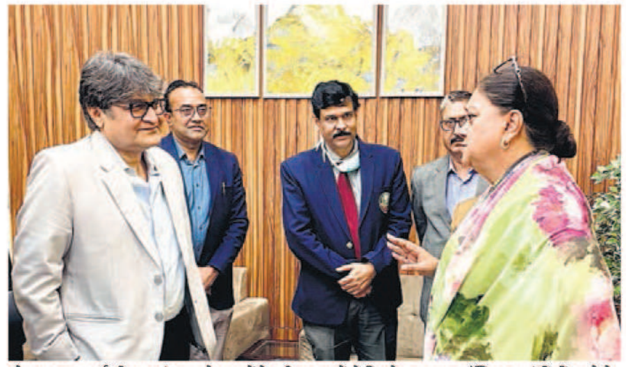
सोमवार सुबह पूर्व सीएम वसुंधरा राजे घायलों के परिवार वालों से मिलने एसएमएस हॉस्पिटल पहुंची थीं। राजे ने उनसे बात की और सीनियर डॉक्टरों से इलाज के बारे में पूछताछ की।

जागरूक जनता नेटवर्क jagrukjanta.net पूर्व मुख्यमंत्री और प्रदेश के कद्दावर नेता वसुंधरा राजे से आलाकमान ने जब भजनलाल शर्मा की पचीं खुलवाई थी तो राजे ने अपने आप को असहज महसूस किया था। उनके राजनीतिक विरोधियों ने भी मान लिया था कि पूर्व मुख्यमंत्री का राजनीतिक करियर अब ढलान पर आ चुका है। वसुंधरा राजे ने भी सत्ता और संगठन से दूरी बना ली थी। लेकिन पिछले कई दिनों से वसुंधरा राजे के हाव-भाव में बदलाव देखने को मिल रहा है। ऐसा माना जा रहा है कि आलाकमान से राजे को कोई ठोस आश्वासन मिला है जिसके चलते वे फिर से पूरी तरह सक्रिय नजर आ रही हैं। राजे ने इन दिनों में प्रदेश के कई जिलों का दौरा भी किया है। इसके साथ ही संगठन के कार्यक्रमों में भी अपनी उपस्थिति दर्ज करवा रही हैं। प्रदेश के जन्म, मरण, परण के कार्यक्रमों में उपस्थिति दर्ज करवा रही हैं। आम जनता से जुड़ाव का कोई मौका नहीं छोड़ रही। वसुंधरा जिस तरह से आम जनता से संपर्क कर रही हैं, उससे उनके राजनीतिक विरोधियों को धूजणी छूट रही है। उपचुनाव में प्रदेश में भाजपा के शानदार प्रदर्शन के बाद यह माना