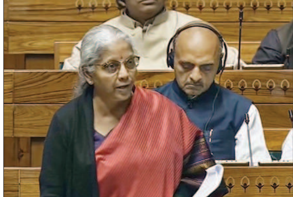
देश के लगभग हर घर में गैस कनेक्शन पहुंच गया है। सरकार ने उज्वला योजना शुरू की जिसके जरिए 10.33 करोड़ कनेक्शन गरीबों को दिए गये हैं और उन्हें 503 रुपए की दर से सिलेंडर दिया जा रहा है। आज बेरोजगारी की दर भी घटी है और यह छह प्रतिशत से घटकर 2023-24 में 3.2 प्रतिशत पर आ गई है। उन्होंने कर्मचारी भविष्य निधि संगठन (ईपीएफओ) पर कहा कि इसमें 91 लाख से अधिक अंशधारक जुड़े हैं जो पिछले साल की इस अवधि की तुलना में 19 प्रतिशत अधिक है। वित्त मंत्री ने कहा "हम पूरक अनुदान मांगों को दो बार ही पेश करने तक सीमित करना चाहते हैं, लेकिन कभी कभी तीन बार इसे पेश किया जा रहा है। इस बार पेश पहली अनुपूरक मांगों की राशि बहुत कम है जो हमारे बजट अनुमानों के करीब-करीब सटीक रहने की धारणा को मजबूत करता है।"

उन्होंने निवेश में कमी को लेकर सदस्यों की चिंता का जवाब देते हुए कहा कि हमारा ध्यान बजट में पूंजीगत खर्च बढ़ाने पर है और बजट में 11.11 लाख करोड़ रुपए का प्रावधान किया गया है। अगर इसमें राज्यों को दिये गये पूंजीगत अनुदान को जोड़ दिया जाए तो यह 15.02 लाख करोड़ रुपए होता है। इसका उद्देश्य आर्थिक बढोत्तरी की गति प्रदान करना है क्योंकि पूंजीगत मद पर एक रुपये का खर्च आर्थिक गतिविधियों को व्यक्तिगत खर्च की तुलना में 3 से 4 गुना बढ़ाता है। उन्होंने कहा कि सरकार पूंजीगत खर्च के माध्यम से दूर दराज के क्षेत्रों को जोड़ने, बुनियादी सुविधाओं को बढ़ाने, सार्वजनिक ढांचे को मजबूत