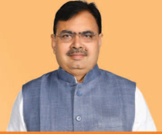
श्री भजनलाल शर्मा माननीय मुख्यमंत्री