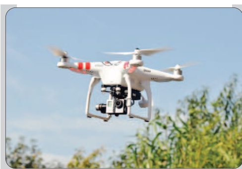
अधिक कारगर हुआ है और जवाबदेही भी बढ़ी है।

प्रधानमंत्री नरेंद्र मोदी ने हाल ही में कहा कि एयर टैक्सी जल्द ही भारत में हकीकत बन जाएगी। इससे संकेत मिलता है कि देश में ड्रोन के क्षेत्र में दूसरी पीढ़ी के सुधार शुरू हो सकते हैं। महज तीन साल पहले तक देश में ड्रोन बनाने और उन्हें चलाने की बात कोई सोच भी नहीं सकता था।