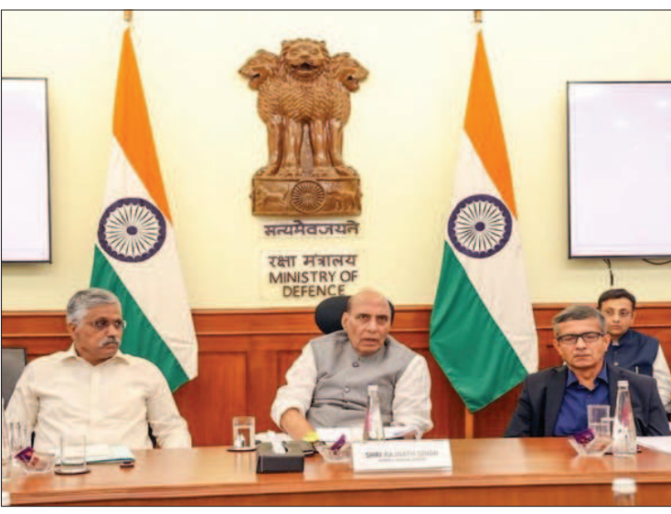
सुराहना की। उन्होंने कहा कि निगमीकरण के बाद, नए उपक्रमों ने उत्पादकता और गुणवत्ता में सुधार किया है। उन्होंने कहा कि बहुत कम समय में इन उपक्रमों की बिक्री और लाभ में अच्छी प्रगति हुई है। रक्षा मंत्री ने विश्वास व्यक्त किया कि नए उपक्रम आधुनिकीकरण और स्वदेशीकरण को आगे बढ़ाएंगे तथा विश्व स्तरीय प्रौद्योगिकियों को शामिल करके गुणवत्ता, कारोबार, लाभ और अन्य वित्तीय मापदंडों में नए आयाम स्थापित करेंगे। उन्होंने कहा, "हमारे नए डीपीएसयू रक्षा उत्पादन के क्षेत्र में भारत को 'आत्मनिर्भर' बनाएंगे।"

नई दिल्ली। रक्षा मंत्री राजनाथ सिंह ने विश्वास व्यक्त किया है कि रक्षा क्षेत्र के सार्वजनिक उपक्रम आधुनिकीकरण और स्वदेशीकरण को बढ़ावा देते हुए देश को आत्मनिर्भर बनायेंगे। सिंह ने मंगलवार को यहां रक्षा मंत्रालय की परामर्शदात्री समिति की बैठक की अध्यक्षता करते हुए यह बात कही। बैठक में पूर्ववर्ती आयुध निर्माणी बोर्ड के निगमीकरण के बाद बनाए गए सार्वजनिक क्षेत्र के नये उपक्रमों की भूमिका और कार्यों पर विचार-विमर्श किया गया। समिति के सदस्यों को वित्तीय आंकड़ों, आधुनिकीकरण, पूंजीगत व्यय, निर्यात, नए उत्पादों और अनुसंधान एवं विकास परियोजनाओं से अवगत कराया गया। रक्षा मंत्री ने महत्वपूर्ण उत्पादों के स्वदेशीकरण, उत्पादन सुविधाओं के आधुनिकीकरण और एमएसएमई को बढ़ावा देने में नए उपक्रमों के प्रयासों की