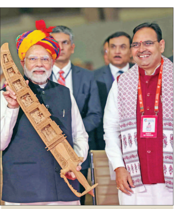
सबसे बड़ा राज्य, लोग भी दिलवाले

कूल निर्यात और एफडीआई भी करीब दोगुना हो गया है। उन्होंने कहा कि हमने बीते दस साल में आधारभूत ढांचे पर खर्च भी करीब 2 ट्रिलियन से बढ़ाकर 11 ट्रिलियन तक पहुंचा दिया है। राजस्थान के विकास से देश को भी मिलेगी नई ऊर्चा प्रधानमंत्री ने कहा कि आजादी के बाद जो सरकारें आईं उन्होंने न तो देश के विकास को प्राथमिकता पर रखा और ना ही देश की विरासत का ध्यान रखा। लेकिन आज हमारी सरकार विकास को, विरासत को के मंत्र पर चल रही है और इसका बहुत बड़ा लाभ राजस्थान को भी हो रहा है। प्रधानमंत्री ने कहा कि भारत के समृद्ध भविष्य में पर्यटन को बहुत बड़ी भूमिका होगी। केंद्र सरकार ने अलग-अलग थीम सर्किट्स से जुड़ी कई योजनाएं भी शुरू की हैं, इन प्रयासों के कारण कोरोना के बावजूद भी बीते दस साल में भारत में 7 करोड़ से ज्यादा विदेशी टूरिस्ट आए हैं। उन्होंने कहा कि दूर, दूर और हरिपेटलेटी सेक्टर की दृष्टि से राजस्थान दुनिया के चुनिंदा स्थानों में से एक है। हेरिटेज टूरिज्म, फिल्म टूरिज्म, इको टूरिज्म, रूरल टूरिज्म, बॉर्डर एरिया टूरिज्म, वन्यजीव पर्यटन की यहां बहुत अधिक संभावनाएं हैं। केंद्र की उद्योग योजना, वंदे भारत, प्रसाद स्कीम, वाइब्रेट विलेज जैसे कार्यक्रमों का राजस्थान को भी बहुत फायदा हो रहा है।