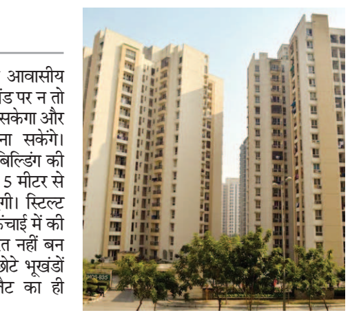
विशेषज्ञों का कहना है कि दोनों में लगभग समानता है, बहुत ज्यादा फर्क नहीं है।

जयपुर। राजस्थान के शहरों की आवासीय योजनाओं, कॉलोनियों में छोटे भूखंड पर न तो ज्यादा ऊंची इमारत का निर्माण हो सकेगा और न ही बिल्डर ज्यादा फ्लैट बना सकेंगे। आवासीय योजनाओं में हाईराइज बिल्डिंग की परिभाषा भी बदलेगी। इसमें अब 15 मीटर से ऊंची इमारत हाईराइज मानी जाएगी। स्टिल्ट पार्किंग की गणना भी इमारत की ऊंचाई में की जाएगी। ऐसे में ज्यादा ऊंची इमारत नहीं बन पाएगी। वहीं, 500 वर्गमीटर से छोटे भूखंडों पर अब बहुनिवास इकाई (फ्लैट का ही रूप) नहीं बनेंगे।