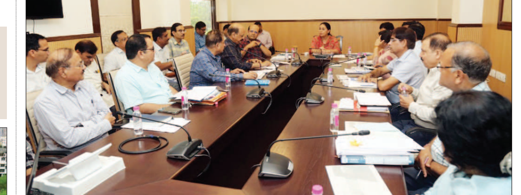
उप मुख्यमंत्री ने की पीडब्लूडी के कार्यों की समीक्षा

फेज-1सी : (बड़ी चौपड़ से ट्रांसपोर्ट नगर तक) इस रूट पर काम चल रहा है। 2.85 किलोमीटर का रूट निर्धारित है। फेज-1डी : (मानसरोवर मेट्रो स्टेशन से 200 फीट बाइपास तक) का भी काम शुरू हो गया है। 1.35 किमी का यह रूट पूरा एलिवेटेड होगा। करीब 30 किमी का होगा फेज-2 फेज-2 (आबावाड़ी से सीकर रोड तक) करीब 30 किलोमीटर का रूट होने का अनुमान है। इसके निर्माण में 5860 करोड़ रुपए खर्च होंगे। पहले यह रूट आबावाड़ी तक था, लेकिन अब इसको बीआरटीएस करिडोर होते हुए सीकर रोड तक ले जाने की योजना है। इससे सीकर रोड के दोनों ओर रहने वाले लोगों की आवाजाही सुगम होगी। पहले इस रूट की लंबाई (सीतापुरा से आबावाड़ी तक) 23 किलोमीटर थी और लागत 4600 करोड़ रुपए थी।