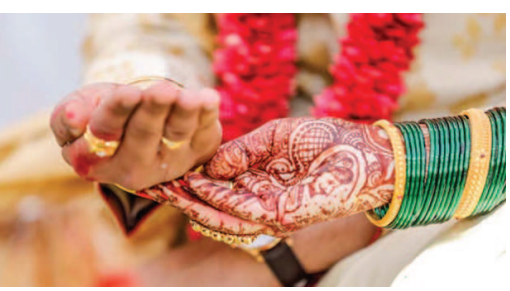
शुक्र ग्रहों के अस्त होने से विवाह समारोहों पर अप्रैल के अंत से लगा विराम 29 जून को समाप्त हो गया। गुरु ग्रह का उदय और शुक्रोदय भी हो गया। शुक्रोदय होने के बाद शहनाईयों की गूजे सुनाई देने लगेगी। इसके बाद सभी शुभ और मांगलिक कार्य शादी, विवाह नामकरण, जनेऊ, मुंडन,

जागरूक जनता jagrukjanta.net जयपुर। मई-जून माह में गुरु व शुक्र ग्रह के अस्त होने से विवाह समारोह पर लगी रोक जुलाई में खत्म हो जाएगी। गुरु ग्रह 3 जून को उदय और शुक्र ग्रह 29 जून को उदय हो चुका है। हालांकि इस बार जुलाई माह में विवाह के केवल 7 मुहूर्त ही हैं। इनमें से सबसे खास मुहूर्त 9, 11 और 15 जुलाई के हैं। 15 जुलाई को भइली नवमी है। इसके बाद गुरु पुर्णिमा से चतुर्मास शुरू हो जाएगा और देवशयनी एकादशी से शादी, विवाह सहित सभी शुभ कार्य बंद हो जाएंगे। ऐसे में जिन परिवारों में शादियां हैं वे तैयारी में जुट गए हैं। गुरु व