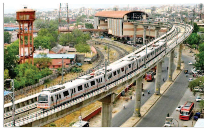
इसका चल रहा काम

जागरूक जनता jagrukjanta.net जयपुर। आने वाले कुछ वर्षों में जयपुर में मेट्रो ट्रेन का नक्शा बदला हुआ नजर आएगा। फेज-02 का काम शुरू होगा और इसके बाद कुछ नए रूट भी धरातल पर आएंगे। फेज-02 (सीतापुरा से सीकर रोड तक) के साथ-साथ मानसरोवर मेट्रो स्टेशन से टोंक रोड पर भी मेट्रो चलाने की तैयारी शुरू हो गई है। यह फेज 10 से 11 किमी लंबा होगा। मेट्रो अधिकारी फेज-02 के साथ-साथ इस नए रूट की भी डीपीआर बनवाएंगे। मेट्रो अधिकारियों की मानें तो जल्द ही डीपीआर के साथ-साथ ट्रैफिक स्टडी के लिए टेंडर प्रक्रिया शुरू की जाएगी। बीते दिनों मानसरोवर के कुछ पार्षदों और विकास समितियों के पदाधिकारियों ने न्यू सांगानेर रोड होते हुए सांगानेर तक मेट्रो चलाने की बात सीएम भजनलाल शर्मा तक पहुंचाई है। माना जा रहा है कि मुख्यमंत्री ने इस रूट में रुचि दिखाई है। क्योंकि इस रूट के दोनों ओर घनी आबादी है और पूरा रूट भी एलिवेटेड होने की वजह से खर्चा भी कम होगा।