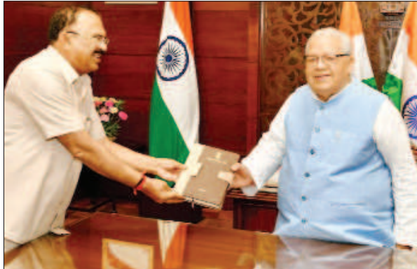
विधानसभा अध्यक्ष देवनानी ने की राज्यपाल से मुलाकात

विधानसभा क्षेत्र में 595 में से 578, फुलेरा विधानसभा क्षेत्र में 632 में से 617, झोटवाड़ा विधानसभा क्षेत्र में 988 में से 961, आमेर विधानसभा क्षेत्र में 199 में से 194, जमवारागढ़ विधानसभा क्षेत्र में 496 में से 489 एवं बानसूर विधानसभा क्षेत्र में 159 में से 159 मतदाताओं ने अपने घर से ही अपने मतदाधिकार का प्रयोग किया। वहीं, दौसा लोकसभा निर्वाचन क्षेत्र में समाहित बस्सी विधानसभा क्षेत्र में 643 में से 632 मतदाताओं ने मतदान किया। बस्सी में 6 मतदाता निधन होने से एवं 5 मतदाता घर पर अनुपस्थित होने के कारण मतदान नहीं कर पाए। उन्होंने बताया कि जयपुर ग्रामीण लोकसभा क्षेत्र में 12 मतदाता निधन एवं 6 मतदाता घर पर अनुपस्थित होने के कारण मतदान नहीं कर पाए। वहीं, सीकर लोकसभा निर्वाचन क्षेत्र में समाहित चौमूं विधानसभा क्षेत्र में 526 में से 508 होम वोटिंग के लिए पंजीकृत मतदाताओं ने अपने घर से ही मतदाधिकार करने की सुविधा का लाभ उठाया। चौमूं विधानसभा क्षेत्र में 12 मतदाता निधन एवं 6 मतदाता घर पर अनुपस्थित होने के कारण मतदान नहीं कर पाए।