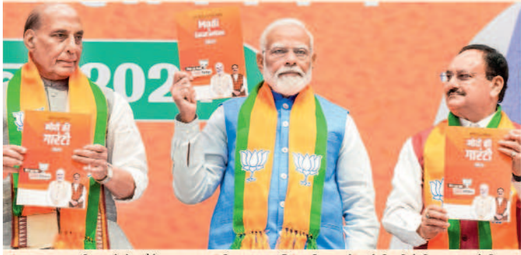
संकल्प पत्र जारी करने के मौके पर रक्षा मंत्री राजनाथ सिंह, पीएम नरेंद्र मोदी, बीजेपी अध्यक्ष जेपी नड्डा