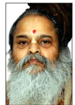
श्री सद्गुरु देव

सत्य दर्शन के आधार श्रीसद्गुरु देव गलितियों तो महापुरुषों से भी होती हैं, लेकिन गलतियों को स्वीकार करके प्रायश्चित्त करने से और फिर ऐसी गलती न हो, ऐसा निश्चय करने से उन दोषों से मुक्त हो जाते हैं। इसी तरह मैं सबसे हाशियार हूँ, दूसरे सब कमजोर हैं। यह भाव व्यक्तता गंधि को यानि अहंकार को जन्म देता है। इसके कारण हम जाने-अनजाने दूसरों का तिरस्कार कर देते हैं। संसार में सबकी प्रकृति, उनका स्वभाव, अलग-अलग होता है, हमें सबके साथ सामाजिक रचना पड़ता है। हम सोचते हैं हम सही हैं, दूसरे ही हमारी तरह ही करें। हम उन्हें सुधारने की चेष्टा करते हैं। किसी को भी सुधारने की शक्ति इस काल में किसी में नहीं है अतः दूसरों को सुधारने का प्रयत्न छोड़ दें। हम खुद सुधारने तभी सामने वाला सुधार सकते हैं। हम दूसरों से आदर्श व्यवहार की अपेक्षा करते हैं मगर हम खुद वैसा नहीं करते। हमारा व्यवहार संतुलित और आदर्श होना चाहिए। शुद्ध व्यवहार ही मानव धर्म है। हमारे अंदर कल्पित भाव ही न रहे तो सामने वाले में भी वैसा भाव नहीं रहते। जहाँ क्रोध होता है वहाँ भगवान नहीं रहते। पर मैं, बाहर, आपस में मतभेद हो सकता है किंतु मन्मथेद नहीं होना चाहिए। मतभेद से भी झगड़े होते हैं, घिन्ता होती है क्लेश होता है, अतः मतभेद दूर कर रहना चाहिए। क्लेश रहित जीवन जीना ही धर्म है। नियम और मर्यादा से ही व्यवहार शोभा देता है। इसलिए जल्दी है कि हम हमारी मर्यादा न तोड़ें और सदा निर्मल रहें। कर्मशः