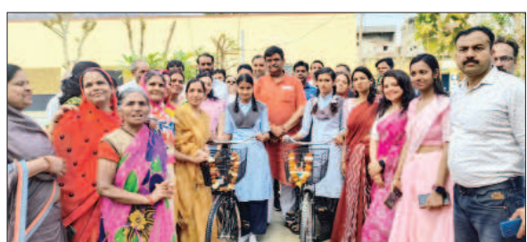
जागरूक जनता jagrukjanta.net

जयपुर। वन एवं पर्यावरण राज्यमंत्री (स्वतंत्र प्रभार) संजय शर्मा ने मंगलवार को अलवर शहर में करीब 3 करोड़ रुपये की लागत के विकास कार्यों का लोकार्पण एवं शिलान्यास कर कहा कि अलवर शहर का चहुंमुखी विकास कराया जाएगा इसके लिए धन की कमी नहीं आएगी।