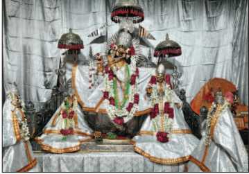
स्वयं और भुजाएं ठाकुर जी के समान हैं, आखरी में तीसरा विग्रह गोविंद देव जी का बना जिनका मुखारविंद ठाकुर जी से मिले ख्याता है। मानता है कि यह तीनों ही विग्रह करे 5000 साल पुराने हैं। श्री गोपीनाथ जी की प्रतिमा यमुना किनारे वंशीघाट पर मिली थी 1669 तक गोपीनाथ जी वृंदावन में ही थे। जब औरंगजेब महरिद तोड़ने लगा तो वहां के महंत, ठाकुर जी को लेकर 1775 में जयपुर पहुंचे 17 साल तक (अभी के) जोरावर सिंह गेट स्थित नेशनल आयुर्वेद कॉलेज के स्थान पर विराजमान रहे और 1792 में उन्हें पुरानी बस्ती स्थित वर्तमान मंदिर में स्थापित किया गया। भारत में अध्यात्म बड़ा शक्तिशाली है और यह अध्यात्म अधिविश्वास नहीं बहुत उन्नत विज्ञान पर आधारित है। कहते हैं गोपीनाथ जी के हाथ में हमेशा घड़ी रहती है इसके पीछे भी एक वाक्या जुड़ा है, आजादी से पहले एक अंग्रेज इस मंदिर में आया था जो भगवान को सिर्फ पत्थर की मूर्ति समझता था और भारत के लोगों को अधिविश्वासी का कर भ्रमाक बना रहा था। उसका कहना था यदि इस कृष्ण विग्रह में प्राण है तो नब्ब से चलने वाली घड़ी विग्रह के पहनने पर भी चलेगी। ठाकुर जी के भक्तों ने चुनौती स्वीकरी और अंग्रेज ने ठाकुर जी को घड़ी पहना दी और आश्चर्य तब हुआ जब वह घड़ी चलने लगी और सही समय बताने लगी। यह देख अंग्रेज अफसर भी ठाकुर जी का भक्त बन गया। हालांकि वर्तमान में ठाकुर जी के हाथ में वह घड़ी नहीं है, उसी का प्रतिरूप है। भक्त और भगवान के बीच आस्था और विश्वास के रिश्ते को दर्शाते श्री गोपीनाथ जी आज भी हमें भगवान, भक्ति और हमारी उन्नत संस्कृति के प्रति और प्रगाढ़ विश्वास रखने की प्रेरणा देते हैं। (ये लेखक के अपने विचार हैं)

गोपिका जीवन स्मरण गोविंदम गोविंदम कृष्ण का एक नाम गोपीनाथ भी है गोपीनाथ याने ग्वालो और गोपियों के स्वामी। फाल्गुन मास का महत्व वैसे तो होला से है, परन्तु उत्तरी भारत में विशेष कर कृष्ण जन्मभूमि उत्तर प्रदेश और राजस्थान के कई भागों में फाल्गुन मास की विशेषता यह है कि, गुलाल, केसर की सुगंध से वातावरण सुगंधित रहता है। डफ, चंग और फाग की धून में लोग प्रसन्नता से झुलते नाचते नजर आते हैं। मन कृष्ण, श्याम, गोपियों के नाथ के प्रति भक्ति प्रेम की भावना से ओत प्रोत रहता है। फाल्गुन के इसी भाव से प्रभावित आज हम कृष्ण के एक और देवस्थान श्री गोपीनाथ जी के बारे में कुछ अति रोचक और रहस्यमय जानकारी साझा कर रहे हैं। लोक कथाओं के अनुसार, श्री कृष्ण के प्रिय वज्रनाथ ने अपने दादा श्री कृष्ण के विग्रह बनवाए जिसमें किसी विग्रह मन मुख, किसी भी चरण किसी भी भुजा और वक्ष स्थल तो किसी मिले कहते हैं एक ही दिन यदि इन तीनों विग्रह के दर्शन कर लिए जाए तो मानो आपने साक्षात् श्री कृष्ण के दर्शन कर लिए, इन्हीं विग्रह में से तीन विग्रह राजस्थान में विराजमान हैं। जो पहला विग्रह बना, वह भद्रन मोहन जी का था, जो वर्तमान में करौली में स्थित है, उनके चरण ठाकुर जी से मिलते हैं। दूसरा विग्रह गोपीनाथ जी का है जो जयपुर के पुरानी बस्ती में स्थित है उनके वक्ष