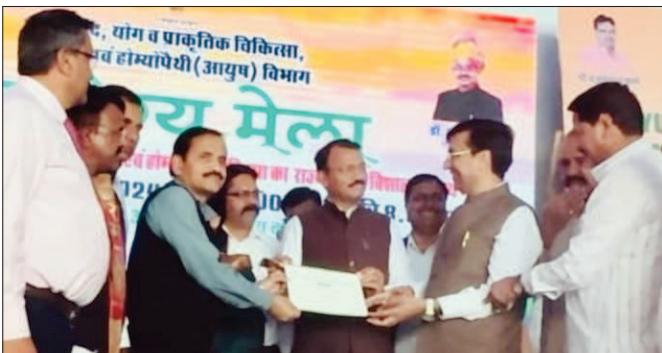
जागरूक जनता jagrukjanta.net

मनोहर लाल खट्टर के इस्तीफे के बाद हुई मुख्यमंत्री के पद की खोज में हरियाणा के अगले सीएम के नाम का ऐलान हो गया। विधायक दल की बैठक में नायब सिंह सैनी के नाम पर मुहर लग गई। आइए जानते हैं हरियाणा के नए मुख्यमंत्री नायब सिंह सैनी के बारे में। नायब सिंह सैनी को