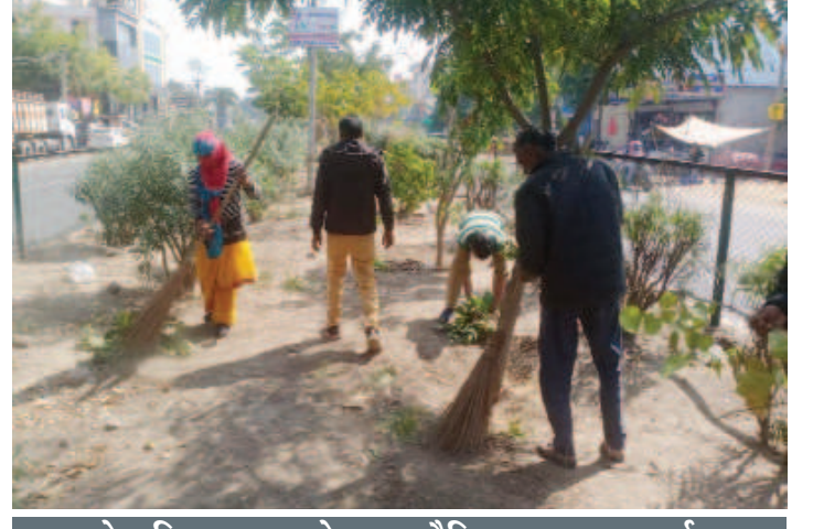
एनके पब्लिक स्कूल के द्वारा स्वैच्छिक श्रमदान कार्यक्रम

जापान, रूस, ऑस्ट्रेलिया आदि और अफ्रीका, प्रशांत, अटलांटिक, आर्कटिक और अंटार्कटिका के हिस्सों में देखा जा सकेगा। इस बार चंद्र ग्रहण से पहले शनि होंगे उदय वैदिक ज्योतिष शास्त्र के अनुसार चंद्र ग्रहण से पहले शनिदेव का उदय होना बहुत महत्वपूर्ण माना जाता है। शनि देव अभी कुंभ राशि में अस्त हैं, जो 18 मार्च को कुंभ राशि में प्रातः 7.49 पर उदित होंगे। शास्त्रों में शनि का उदय होना एक शुभ घटना मानी जाती है।