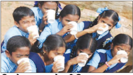
पिछले 3-4 माह से नहीं मिल रहा था दूध पिछले करीब 3-4 महीनों से स्कूलों में मुख्यमंत्री बाल गोपाल योजना के तहत दूध पाउडर की सलाई नहीं हो रही थी। इससे प्रदेश के 80 फीसदी से ज्यादा स्कूलों में बच्चों को दूध नहीं मिल पा रहा था।

उदयपुर। राजस्थान के सरकारी स्कूलों में मिड डे मील में राज्य सरकार ने बड़ा बदलाव किया है। मुख्यमंत्री बाल गोपाल योजना के तहत सरकारी स्कूलों में पाउडर वाले दूध की जगह अब गाय का ताजा दूध पिलाया जाएगा। इस संबंध में अतिरिक्त निदेशक माध्यमिक शिक्षा अशोक कुमार असीजा ने आदेश जारी किए हैं। साथ ही स्कूलों में स्वच्छता को लेकर भी विशेष आदेश जारी कर शिवालयों में नियमित साफ-सफाई रखने के निर्देश दिए हैं।