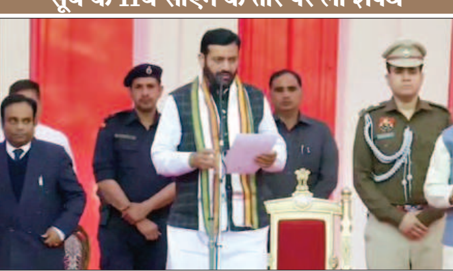
जागरूक जनता jagrukjanta.net

नई दिल्ली। हरियाणा की राजनीति में मंगलवार का दिन काफी उथल-पुथल भरा रहा। पहले मुख्यमंत्री मनोहर लाल खट्टर ने अपने पद से इस्तीफा दिया और अब कुरुक्षेत्र से सांसद नायब सैनी ने शाम करीब 5.30 बजे राजभवन में आयोजित शपथ ग्रहण समारोह में हरियाणा के नए मुख्यमंत्री के तौर पर शपथ ली। उनके साथ ही कई नेताओं ने मंत्री पद की शपथ ली।