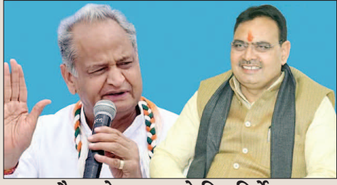
बैनर पोस्टर हटाने दिए निर्देश

जयपुर। राजस्थान में जबसे भजनलाल सरकार बनी तबसे ही जनता के हित में बड़े बदलाव हो रहे हैं। 450 रुपए में गैस सिलेंडर देने से लेकर महिलाओं की पेंशन में वृद्धि तक कई बड़े बदलाव किए हैं। अब भजनलाल सरकार पूर्व मुख्यमंत्री अशोक गहलोत की महत्वकांक्षी योजना 'मुख्यमंत्री चिरंजीवी स्वास्थ्य बीमा योजना' का पोस्टमार्टम कर दिया है। इस योजना को नाम बदलकर अब 'मुख्यमंत्री आयुष्मान आरोग्य योजना' कर दिया है।