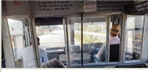
शिकायत पेटिका भी सही स्थिति में हो

जयपुर। राजस्थान रोडवेज अपनी सुगम, सुरक्षित और सुविधाजनक यात्रा के लिए जानी जाती है। लेकिन, मुख्यालय को बार-बार ऐसी शिकायतें मिल रही थीं बस में अंकित अधिकारियों व अन्य सहायता व सुविधा नम्बर पूरे नहीं होते हैं, किसी में आगे के नम्बर नहीं होते हैं, कहीं पीछे के दो-तीन अंक गायब मिलते हैं। इसके चलते मुख्यालय ने बसों में यात्री सुविधा के नम्बर अच्छी तरह से अंकित करने के निर्देश जारी किए हैं। साथ ही, शिकायत पेटिका को भी सभी बसों में दुरुस्त किया जाएगा।