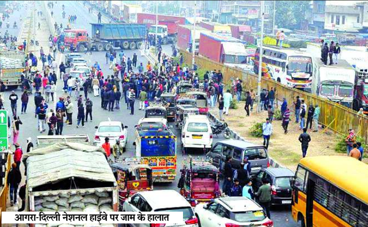
आमरा-दिल्ली नेशनल हाइवे पर जाम के हालात