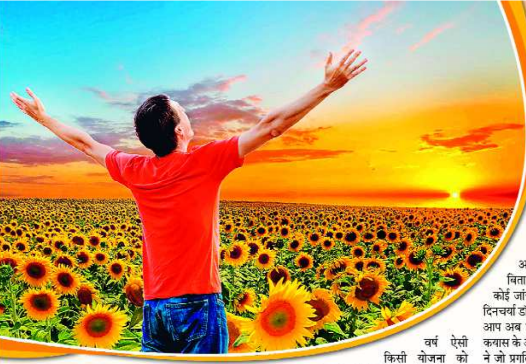
» जागरूक जनता jagrukjanta.net

य ह जीवन सुख-दुःख और हर्ष-विषाद की एक अनवरत यात्रा है। हमारी कामनाएं इस यात्रा को गति देती हैं और परेशानी का कारण भी बनती हैं। इस वर्ष आपने ना जाने कितनी योजनाएं बनाई होंगी। कुछ पूरे हुए होंगे और कुछ शेष होंगे। कल की बेहतरी की उम्मीद जिजीविषा को बनाए रखती है और जीवन को नए मायने देती है। वस्तुतः नए पन का बोध व्यक्ति को ऊर्जा से भर देता है और यही ऊर्जा मनुष्य के विकास का आधार है। कल से आरंभ हो रहे नववर्ष में हम स्व प्रबंधन की दिशा में कदम बढ़ा सकते हैं।