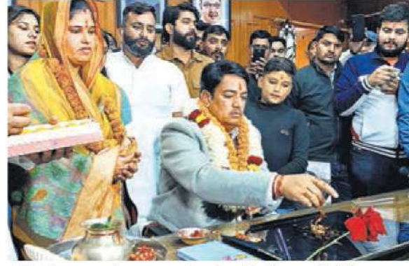
मंत्री अविनाश गहलोत पदभार संभालने पहुंचे परिवार व मित्रों के साथ।