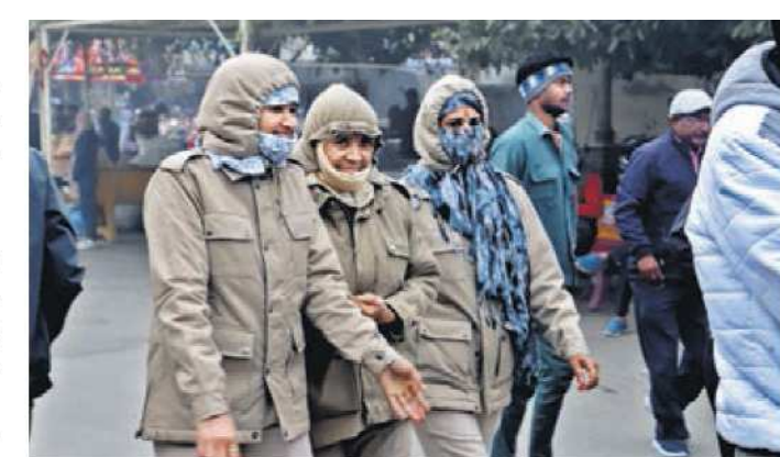
प्रदेश की राजधानी जयपुर में सोमवार को तेज सर्दी ने लोगों को ठिठुरा दिया। शहर के प्रमुख पर्यटन स्थल आमेर और जलमहल के आसपास कोहरे का असर बहुत ज्यादा रहा, जिस कारण लोगों ने अलावा जलाकर सर्दी से बचाव करने की कोशिश की।

मौसम विभाग के अनुसार माउंट आबू के अलावा फलोदी का न्यूनतम तापमान 5.2, सीकर का 6.4, संगरिया और सिरौही का पारा 7.7, अलवर और श्रीगंगानगर का 8.2, पिलानी का 8.5, फतेहपुर का 8.7, अजमेर और करौली का 8.8,