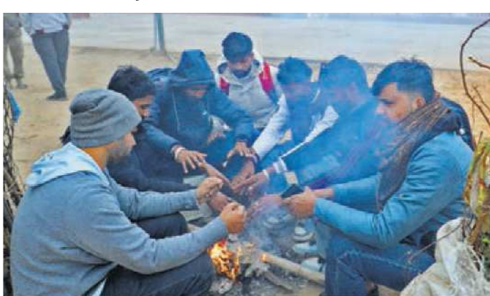
प्रमुख शहरों की एक्यूआई