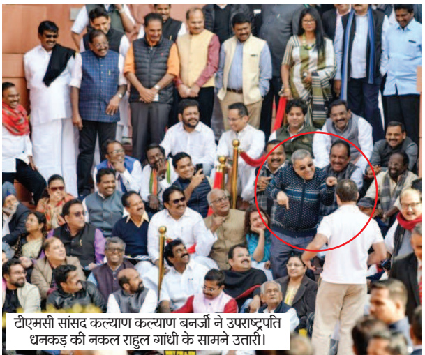
टीएमसी सांसद कल्याण कल्याण बनर्जी ने उपराष्ट्रपति धनकुड़ की नकल राहुल गांधी के सामने उतारी।

अब ये बड़े नेता हुए सस्पेंड लोकसभा की कार्रवाई को बाधित करने और सिंहासन की तरफ गलत आचरण के आरोप में कांग्रेस के लोकसभा सांसद मनोप तिवारी, कांति चिदंबरम, शशि थरूर, बीएसपी से (निष्कासित) दानिशा अली, एनसीपी की सुप्रिया सुले, सपा सांसद एसटी हसन, टीएमसी सांसद माला राय, सपा नेता डिपल यादव और आम आदमी पार्टी के सांसद सुशील कुमार रिंकू को सस्पेंड किया गया है। इस बात की जानकारी कानून मंत्री अर्जुन राम मेघवाल ने दी है।