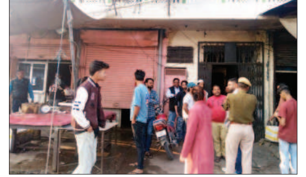
ग्रेटर निगम में 20 दुकानों पर कार्रवाई

जयपुर। शहर में मीट की अवैध दुकानों पर ग्रेटर और हैरिटेज नगर निगम ने कार्रवाई शुरू कर दी है। ग्रेटर निगम ने अब तक मीट की 5 अवैध दुकानों को सीज कर दिया है, वहीं 15 दुकानों से मीट जब्त कर नोटिस थमा दिए हैं। 35 लोग लाइसेंस लेने भी पहुंचे हैं। जबकि हैरिटेज नगर निगम ने मीट की 10 अवैध दुकानों के चालान किए, जिन्हें लाइसेंस लेने के लिए 7 दिन का समय दिया गया है। राजधानी में अवैध मीट दुकानों को लेकर जागरूक जनता ने 13 दिसंबर को 'दिन में सफाई, रात में वही शनाई, निगम मौन' शीर्षक से समाचार प्रकाशित कर इस मामले को उठाया। इसके बाद ग्रेटर नगर निगम और हैरिटेज नगर निगम ने शहर में अवैध मीट दुकानों पर कार्रवाई शुरू की, वहीं सर्वे कार्य जारी है।