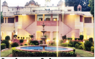
कितने कचरा डिपो पर हूपर

जयपुर। हैरिटेज नगर निगम ने परकोटे के बाजारों के साथ मुख्य मार्गों को 'कचराडिपो फ्री सिटी' बनाने की कवायद फिर से शुरू कर दी है। इसके लिए कचरा डिपो पर एक-एक हूपर खड़े किए जाएंगे, जिससे सीधे ही हूपर में कचरा डाला जा सकेगा। वहीं बड़े कचरा डिपो पर हर जाने में गार्ड तैनात किए जाएंगे, जो लोगों से समझाव देकर कचरा डिपो नहीं डालने के लिए पाबंद करेंगे। बार-बार कचरा डालने वालों के चालान भी किए जाएंगे।