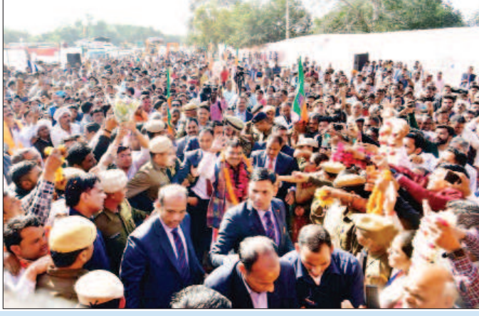
जागरूक जनता @ मुख्यमंत्री भजन लाल शर्मा के भरतपुर दौरे के दौरान विभिन्न स्थलों पर आमजन और जन-प्रतिनिधियों ने उनका स्वागत किया।