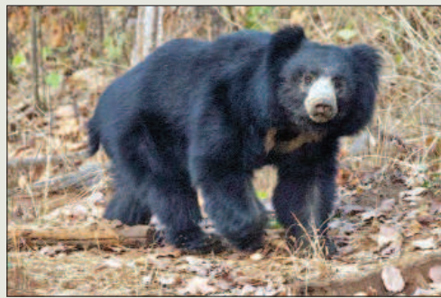
दीमक को खाते हैं जिससे वनस्पति को जीवनदान मिलता है। बीस साल होती है उम्र वन्य जीव विशेषज्ञों की माने तो भालू की औसत आयु करीब बीस साल होती है। भालू के नाखून नुकीले होने के कारण बाघ भी

सवाईमाधोपुर। बाघों के कारण देश व दुनिया में रणथम्भौर नेशनल पार्क को जाना जाता है, लेकिन अब रणथम्भौर में ना सिर्फ बाघ बल्कि दुर्लभ प्रजाति कहे जाने वाले भालू भी पर्यटकों के आकर्षण का केंद्र बनते जा रहे हैं। यहां कभी भालूओं की प्रजाति धीरे-धीरे लुप्त होने के कगार पर थी ए लेकिन अब भालूओं की संख्या में लगातार इजाफा हो रहा है। इससे वन्य जीव प्रेमियों में खुशी की लहर है वन विभाग से मिली जानकारी के अनुसार वर्तमान में रणथम्भौर में 100 से अधिक भालू हैं।