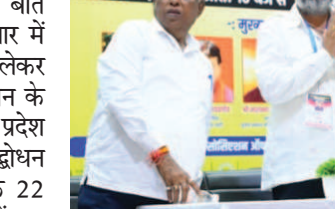
फेक न्यूज और फर्जी पत्रकारों के खिलाफ आंदोलन चलेगा एनयूजेआई

जागरूक जनता jagrukjanta.net जयपुर। नेशनल यूनिन ऑफ जर्नलिस्ट्स, इंडिया का दो दिवसीय राष्ट्रीय अधिवेशन बोते रिविवा को यहां जयपुर स्थित निम्स सभागार में सम्पन्न हुआ। अधिवेशन में पत्रकार हितों को लेकर कई प्रस्ताव पारित किए गए। राष्ट्रीय अधिवेशन के समापन सत्र के मुख्य अतिथि भाजपा के पूर्व प्रदेश अध्यक्ष डॉ सतीश पूनिया थे। उन्होंने अपने उद्बोधन में स्वयं को मेजबान बताते हुए देश भर के 22 राज्यों से आए 1500 से अधिक पत्रकारों का स्वागत किया और कहा कि 90 के दशक में जब ऐसा अधिवेशन जयपुर में हुआ था तब वे छात्र संगठन के साथ जुड़े थे और कुर्सियां लगाई थीं, आज इसी संगठन के तत्वाधान में हो रहे कार्यक्रम में वह मंच पर हैं। उन्होंने इसे पत्रकारों की कलम की ताकत बताते हुए कहा कि वे स्वयं उदाहरण हैं कि कुर्सी लगाने वाले को आज उसी मंच की कुर्सी पर बैठाया गया है। उन्होंने कहा कि खेत में किसान का पसीना गिरता है तभी फसल लहराती है, सीमा पर जवान का शौर्य दमकता है तब देश सुरक्षित रहता है, नींव में श्रमिक का पसीना गिरता है तब बुनियाद मजबूत होती है, उसी तरह सच्चे और निर्भीक पत्रकार की कलम की स्याही जब कागज पर उभरती है, तब लोकतंत्र मजबूत होता है। पूनिया ने चिंता व्यक्त करते हुए