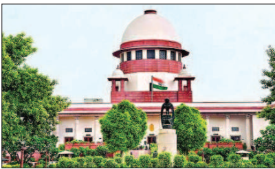
C,JI बोले- 35A ने गैर-कश्मीरियों के अधिकार छीने

सुप्रीम कोर्ट ने कहा कि वह राष्ट्रीय हित में जम्मू-कश्मीर को दो अलग यूनिन टेरिटरी में बांटने के केंद्र के फैसले को स्वीकृति देने की इच्छुक है। कोर्ट ने केंद्र से सवाल किया कि जम्मू-कश्मीर को यूनिन टेरिटरी बनाने का कदम कितना अस्थायी है और उसे वापस राज्य का दर्जा देने के लिए क्या समय सीमा सोच रखी है, इसकी जानकारी दें। यह भी बताएं कि वहां चुनाव कब कराएंगे।