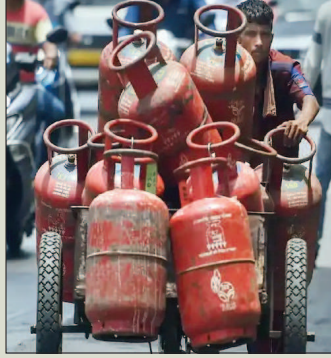
लाभार्थियों के खाते में 400 रुपये आएंगे। यानी उन्हें सिलेंडर 703 रुपये का पड़ेगा। आम उपभोक्ताओं के

नई दिल्ली। मोदी सरकार ने रक्षाबंधन और ओपणम पर देशवासियों का तोहफा दिया है। सरकार के एलपीजी सिलेंडर की कीमत में 200 रुपये की कमी करने का फैसला किया है। प्रधानमंत्री नरेंद्र मोदी की अध्यक्षता में आज हुई कैबिनेट की बैठक में यह फैसला लिया गया। प्रधानमंत्री उज्वला योजना के लाभार्थियों को 200 रुपये का अतिरिक्त फायदा मिलेगा। उन्हें पहले से ही सब्सिडी के रूप में 200 रुपये मिल रहे हैं। इस तरह अब उनके खाते में 400 रुपये की सब्सिडी आएगी। अभी दिल्ली में बिना सब्सिडी वाले 14.2 किलो के एलपीजी सिलेंडर की कीमत 1103 रुपये है। उज्वला योजना के