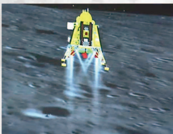
चंद्रयान-3 का लैंडर अपनी स्पीड कम करता हुआ चाँद की सतह पर उतरा।

भारतीय अंतरिक्ष एजेंसी ISRO के चंद्रयान-3 के लैंडर विक्रम ने चंद्रमा के करीब 70.8 डिग्री दक्षिण अक्षांश पर मैन्जिनस सी और सिम्प्लियस एन क्रेटर के बीच टचडाउन किया। अमेरिकी अंतरिक्ष एजेंसी नासा की तरफ से बताया गया है कि यह जगह दक्षिणी ध्रुव से करीब 600 किलोमीटर दूर स्थित है। भारत दुनिया में पहला ऐसा देश बना है जो चाँद के दक्षिणी ध्रुव यानी साउथ पोल पर उतर सका है। चंद्रमा का दक्षिणी ध्रुव अभी भी काफी हद तक रहस्यमय क्षेत्र है। यहाँ अभी तक कोई और लैंडिंग नहीं कर सका है। ISRO की तरफ से कहा गया है कि चंद्रमा का दक्षिणी ध्रुव विशेष रूप से दिलचस्प है क्योंकि यहाँ छाया में रहने वाला सतह क्षेत्र चंद्रमा के उत्तरी ध्रुव की तुलना में बहुत बड़ा है। इसका मतलब यह है कि जो क्षेत्र स्थायी रूप से छायाग्रस्त है, वहाँ पानी जमा होने की संभावना है। NASA के मुताबिक, चंद्रमा के दक्षिणी ध्रुव पर सूर्य क्षितिज के नीचे या हल्का सा ऊपर रहता है। ऐसे में जितने दिन सूर्य की थोड़ी-बहुत रोशनी दक्षिणी ध्रुव के पास पहुंचती है, उन दिनों में तापमान 5.4 डिग्री सेल्सियस पहुंच जाता है। लेकिन इस क्षेत्र में कई ऊंचे पर्वत और गहरे गड्ढे मौजूद हैं जो रोशनी वाले दिनों में भी अंधेरे में डूबे रहते