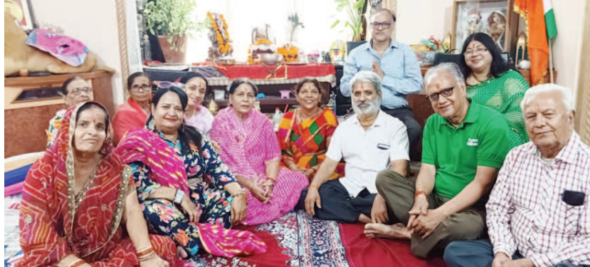
साप्ताहिक शिव पुराण कथा सम्पन्न

इस अवसर पर राजस्थान राज्य प्रदूषण नियंत्रण मंडल द्वारा इंडकेशन एवं रीहीटिंग फर्नेस क्षेत्रों के चयनित उद्योगों को प्लेटिनियम एवं गोल्ड अवार्ड से नवाजा गया। इंडकेशन फर्नेस क्षेत्रों के अंतर्गत श्री कृष्णा रोलिंग मिल्स जयपुर को प्लेटिनियम अवार्ड , रतन इंजीनियरिंग कंपनी प्राइवेट लिमिटेड भिवाड़ी, रतन इंजीनियरिंग कंपनी प्राइवेट लिमिटेड काहरानी इंडस्ट्रियल परिया,भिवाड़ी एवं बालाजीमहिमा अलॉय प्राइवेट लिमिटेड को गोल्ड अवार्ड से सम्मानित किया गया। इसके अतिरिक्त रीहीटिंग श्रेणी में श्री पृथ्वी स्टील रोलिंग मिल्स,जयपुर एवं कामधेनु इस्पात लिमिटेड, जयपुर को प्लेटिनियम अवार्ड एवं श्री कृष्णा रोलिंग मिल्स, जयपुर, पेट्रोपॉल इंडिया लिमिटेड व आशियाना मैनुफैक्चरिंग इंडिया लिमिटेड को गोल्ड अवार्ड से नवाजा गया।