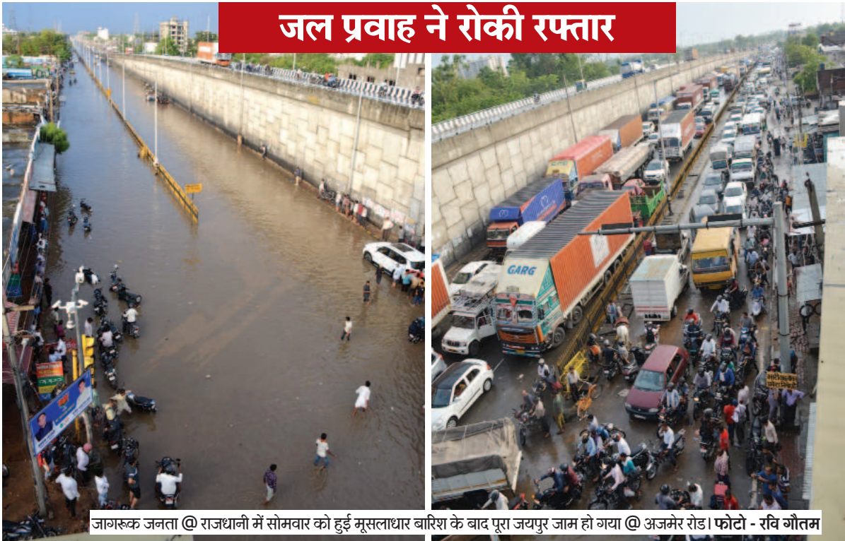
जागरूक जनता @ राजधानी में सोमवार को हुई मूसलाधार बारिश के बाद पूरा जयपुर जाम हो गया @ अजमेर रोड।