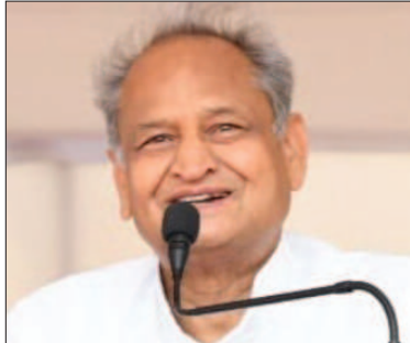
मैं फुटबॉल अकादमी, बीकानेर में साईकिलिंग अकादमी, भीलवाड़ा में कुरुती अकादमी, चूरू के राजाजी में एथलेटिक्स अकादमी के साथ ही बाड़मेर और सीकर में बास्केटबॉल अकादमी की स्थापना की जाएगी। इन अकादमीयों का निर्माण 2-2 करोड़ रुपए की लागत से होगा। जबकि नागौर के डीडवाना में कबड्डी अकादमी का निर्माण 25 लाख रुपए की लागत से किया जाएगा। बता दें कि मुख्यमंत्री द्वारा साल 2023-24 के बजट में इन तीनों की घोषणा की थी। जिसे पूरा करते हुए अब सरकार ने निर्माण के आदेश जारी कर दिए हैं। वहीं चुनावी साल में ही सरकार ग्रामीण और शहरी ओलम्पिक का आयोजन भी करने जा रही है। जिसमें 40 लाख से ज्यादा राजस्थानियों के शामिल होने की संभावना है।

जागरूक जनता jagrukjanta.net जयपुर। राजस्थान में चुनावी साल में आम जनता को खुश करने के लिए सरकार कोई कसर नहीं छोड़ना चाहती। ऐसे में चुनाव से 6 महीने पहले सरकार ने प्रदेश के सीकर, बांसवाड़ा, बीकानेर, भीलवाड़ा, चूरू, नागौर और बाड़मेर में खेल अकादमी बनाने का फैसला किया है। जिसके लिए शनिवार को मुख्यमंत्री अशोक गहलोत ने 14 करोड़ 25 लाख रुपए की वित्तीय स्वीकृति जारी की। जिससे खेल खेल अकादमीयों का निर्माण किया जाएगा। इनमें सीकर के कोलिङ और बांसवाड़ा