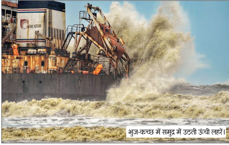
भुज-कच्छ में समुद्र में उठी ऊंची लहरें।