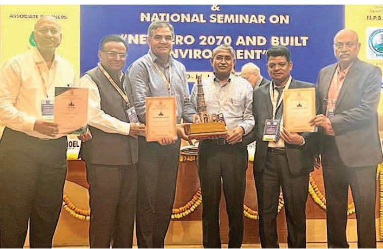
राष्ट्रीय स्तर पर सराहे गए मंडल के चारों प्रोजेक्ट्स रहे चर्चा में