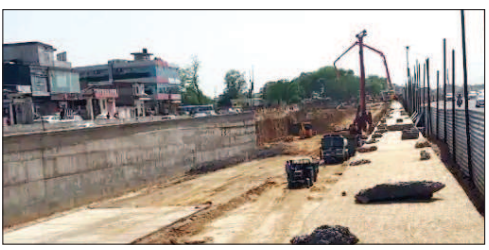
ये काम शुरू किया

प्रोजेक्ट जेएलएन मार्ग पर ओटीएस चौराहे पर शुरू होना था, जिसे फिलहाल ठण्डे बस्ते में रख दिया है। इस प्रोजेक्ट की डिजाइन और डीपीआर तैयार करने के बाद यहाँ केबिल ब्रिज बनाना प्रस्तावित था। इसके लिए टेण्डर प्रक्रिया भी शुरू कर दी थी, लेकिन बाद में इसे रोक दिया। अगले साल आने तक करना होगा इंतजार इन दोनों प्रोजेक्ट्स को पूरा होने में अभी करीब एक साल का समय और लगेगा। जेडीए के अधिकारियों के मुताबिक लक्ष्मी मंदिर तिराहे का काम अगले साल अप्रैल तक पूरा हो सकेगा। लेकिन इसका लोकार्पण लोकसभा चुनाव बाद जून या जुलाई में ही किया जा सकेगा। इसी तरह बीटू बाइपास का काम पूरा होने में अभी एक साल से ज्यादा का समय और लग सकता है।