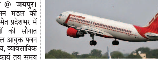
जागरूक जनता jagrukjanta.net

जयपुर। कोरोना के बाद तीन साल के अंतराल पर जयपुर से हज के लिए फ्लाइट्स का संचालन शुरू होगा। हज पर जाने वाले यात्रियों को जयपुर एयरपोर्ट के टर्मिनल-1 से फ्लाइट पकड़नी होगी। एयर इंडिया की ओर से संचालित की जाने वाली 27 फ्लाइट्स का संचालन 21 मई से 6 जून तक होगा। जयपुर एयरपोर्ट ऑथोरिटी के मुताबिक फ्लाइट पहले एक सप्ताह में एक ही चलेगी, लेकिन अगले सप्ताह यानी 28 मई से फ्लाइट्स की संख्या दिन में दो हो जाएगी। वहीं, रिटर्न में ये फ्लाइट्स का संचालन 3 से 24 जुलाई तक होगा।