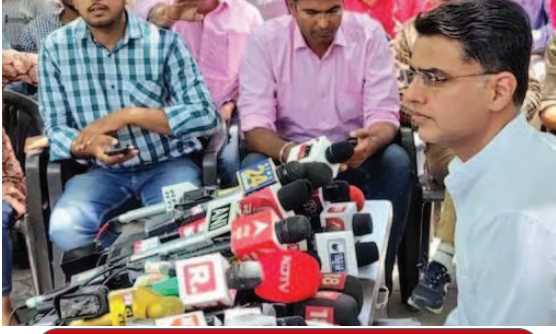
करण मुद्दे पर पायलट कर चुके अनशन

जयपुर। राजस्थान सीएम अशोक गहलोत और नेता सचिन पायलट के बीच की लड़ाई अब खुलकर सामने आई है। उन्होंने गहलोत के आरोपों पर मंगलवार को खुलकर जवाब दिया। उन्होंने कहा, 'पहली बार देख रहा हूँ कि कोई अपनी ही पार्टी के सांसदों और विधायकों की आलोचना कर रहे हैं। भाजपा नेताओं की तारीफ और कांग्रेस नेताओं का अपमान मेरी समझ से बाहर है। यह पूरी तरह गलत है।'