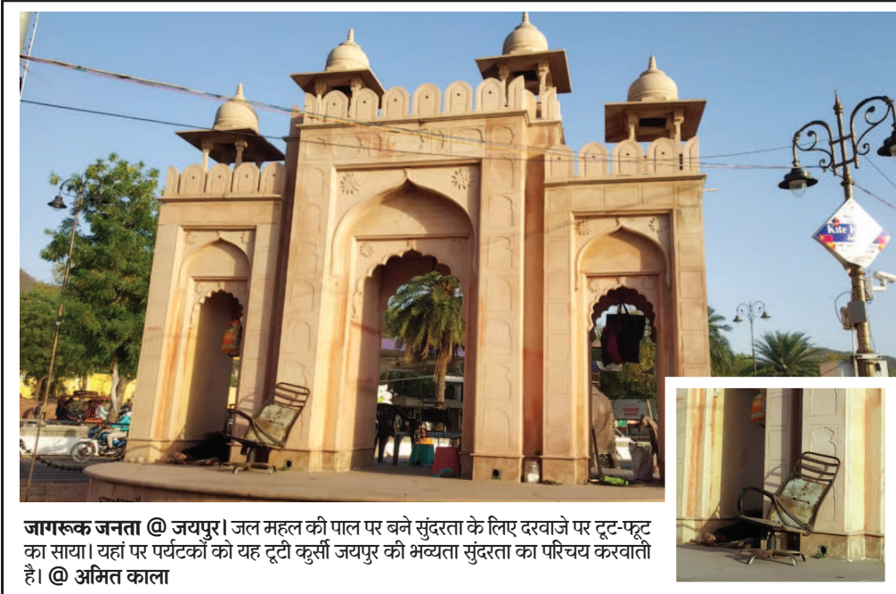
जागरूक जनता @ जयपुर। जल महल की पाल पर बने सुंदरता के लिए दरवाजे पर टूट-फूट का साया। यहां पर पर्यटकों को यह टूटी कुर्सी जयपुर की भव्यता सुंदरता का परिचय करवाती है।