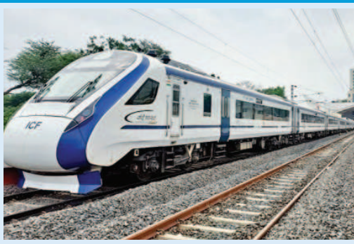
वरिष्ठ अधिकारी ने बताया कि जयपुर-दिल्ली रूट पर ट्रेन

जयपुर। रेलवे द्वारा 24 दिन पहले शुरू की गई अजमेर से दिल्ली केंद्र के बीच वंदे भारत ट्रेन यात्रियों के बीच लोकप्रिय नहीं बन सकी। इसके पीछे किराए के अलावा भी कई कारण हैं, जिसमें समय रहते अगर सुधार नहीं किया गया, तो जिस विजन के साथ ट्रेन को चलाया गया है, वह पूरा नहीं हो पाएगा। हालांकि ट्रेन पीक सीजन में तो खाली नहीं दौड़ेगी, क्योंकि दिल्ली या इसके आगे कनेक्टिंग ट्रेन पकड़ने के लिए ये एक वैकल्पिक ट्रेन है। ऐसा इसलिए क्योंकि करीब 55% यात्री ट्रेन में टिकट बुकिंग तभी करते हैं, जब उनके पास कोई अन्य विकल्प नहीं होता। रेलवे के एक