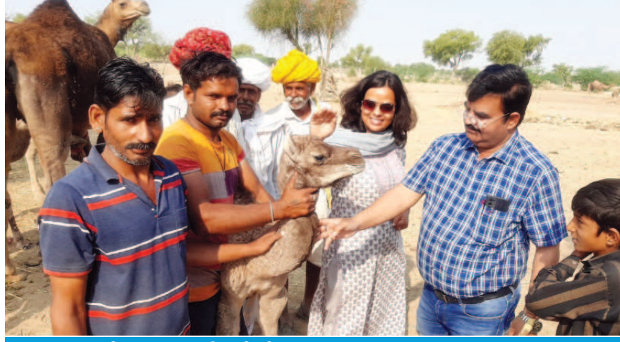
प्रोत्साहन राशि से बेहतर ऊंट पालन हुआ संभव

उद्देश्यनीय है कि योजना के अंतर्गत अब तक 17000 से अधिक ऑनलाइन आवेदन प्राप्त हो चुके हैं। साथ ही योजना अंतर्गत चयनित ऊँट पालकों के खाते में सीधे ही राशि हस्तांतरित की जा रही है। वहीं लाभार्थियों के भौतिक सत्यापन के लिए विभाग के वरिष्ठ अधिकारी मौके पर जाकर ऊँटनी एवं टोडियों के लगाए गए टैग एवं नंबरों की जांच कर ही योजना का लाभ देकर पारदर्शिता का पूरा ध्यान रखा जा रहा है। आज प्रदेश ऊँट संरक्षण के क्षेत्र में सिरमौर बनेक सामने आ रहा है। योजना के लागू होने से ऊँट पालकों का आर्थिक संवर्धन होने के साथ राज्य पशु ऊँट के संरक्षण की दिशा में भी नए रास्ते खुलने लगे हैं।