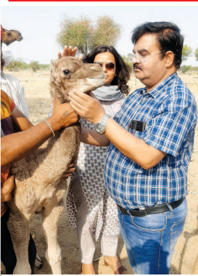
जागरूक जनता jagrukjanta.net

ऊट संरक्षण योजना अंतर्गत 17000 से अधिक आवेदन हुए प्राप्त