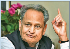
जागरूक जनता jagrukjanta.net

मुख्यमंत्री का संवेदनशील निर्णय किसानों के लिए 736 करोड़ रुपए का ब्याज अनुदान स्वीकृत