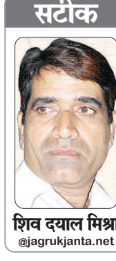
सटीक शिव दयाल मिश्रा @jagrukjanta.net