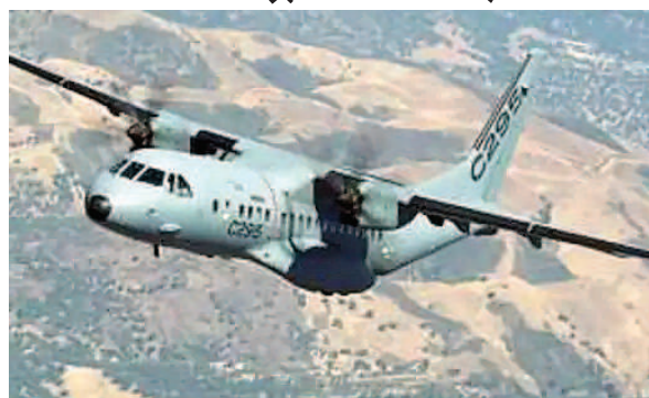
16 रेडी फ्लाई मिलेंगे, 40 असेम्बल होंगे

गांधीनगर/जयपुर। रक्षा उपकरणों की सबसे बड़ी प्रदर्शनी डिफेंस एक्सपो 2022 का आगाज मंगलवार से गांधीनगर में हो गया है। रक्षा क्षेत्र में आत्मनिर्भर बनने के लिए एक्सपो में पहली बार सिर्फ स्वदेशी कंपनियों ही भाग लेंगी। वे ही विदेशी कंपनियों में शिरकत करने जा रही हैं, जो यहां की बड़ी डिफेंस कंपनियों से ज्वाइंट वेंचर करे रही हैं। इस अभियान के तहत ही इंडियन एयरफोर्स के ट्रांसपोर्ट बेड़े के लिए 22 हजार करोड़ की लागत से एयरबस से खरीदे जा रहे हैं 56 सी-295 एमडब्ल्यू ट्रांसपोर्ट एयरक्राफ्ट की खरीद हो रही है। इस विमान प्रोडक्शन लाइन गुजरात के धोलेरा स्थित स्पेशल इन्वेस्टमेंट रीजन में स्थापित किया जाना है। एयरबस डिफेंस एंड स्पेस