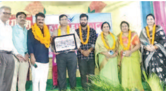
जागरूक जनता jagrukjanta.net