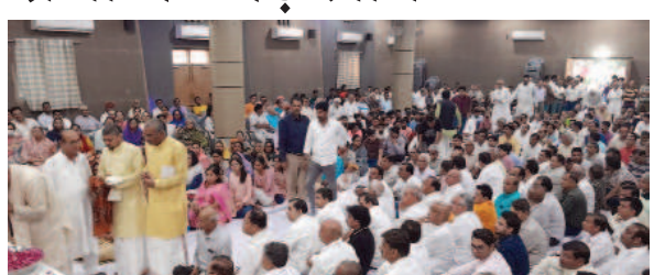
जागरूक जनता jagrukjanta.net