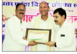
जयपुर @ जागरूक जनता। मानसरोवर स्थित अंकर मैरिज हॉल में समाज के गोट और दीपावली मिलन का समारोह सम्पन्न हुआ।

■ शुक्ल उतर प्रदेश बिहार संयुक्त समाज के अध्यक्ष निर्वाचित