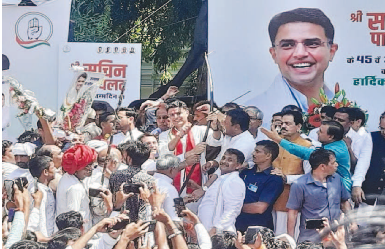
जागरूक जनता jagrukjanta.net