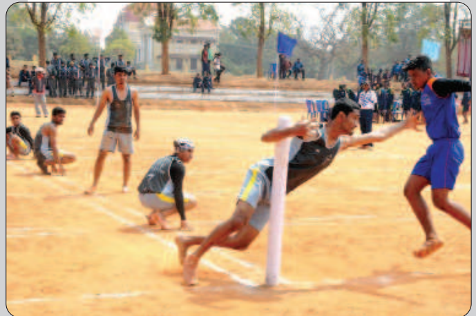
बहरहाल, अब समय बदल गया है। भारतीय स्कूलों की गतिविधियों में 75 उन भारतीय खेलों का श्रीगणेश होगा, जिन्हें इस देश में पीढ़ियों से खेला गया है। भगवान गणेश और अन्य देवताओं से जुड़े गुल्ली-डंडा या अन्य पारंपरिक खेलों के प्रसंग अक्सर सुने-सुनाए जाते रहे हैं। मुंशी प्रेमचंद की एक कहानी है गुल्ली-डंडा, जिसकी पंक्तियां हैं, 'विलायती खेलों में सबसे बड़ा ऐब है कि उसके सामान महंगे होते हैं। जब तक कम से कम एक सैकड़ न खर्च कीजिए, खिलाड़ियों में शुमार ही नहीं हो पाता। यहां गुल्ली-डंडा है कि बिना हर्-फिटकरी के चोखा रंग देता है, पर हम अंगरेजी चीजों के पीछे ऐसे दिवाने हो रहे हैं कि अपनी सभी चीजों से अरुचि हो गई है।' पारंपरिक खेलों को चलाने में लौटाने की कोशिश सराहनीय है। इन खेलों को शामिल करने के जो प्रमुख कारण बताए जा रहे हैं, वे हैं- बच्चों में सामूहिकता की भावना बढ़ाना, ज्यादा से ज्यादा शारीरिक गतिविधियां और अपनी संस्कृति से परिचित कराना।

पिछली पीढ़ियों ने बहुत से ऐसे पारंपरिक खेल खेले हैं, जिन्हें खेलों की प्रचलित दुनिया में शायद खेल नहीं माना जाता। कंकड़ों से गिट्टू, लंगड़ी टांग, चोर-सिपाही, खो-खो, जिसमें यही गाते हुए बच्चे दौड़ते थे, कोड़ा जमाला शाही, पीछे देखा आफत आई। लेकिन बच्चों की दुनिया में वक के साथ बदलाव आया। स्कूलों में फुटबॉल, टेनिस, बैडमिंटन, क्रिकेट खेले जाने लगे। इनकी अंतरराष्ट्रीय, राष्ट्रीय प्रतियोगिताओं का सीधा प्रसारण भी होने लगा। तकनीक के बदलाव के साथ वीडियो गेम्स, कंप्यूटर गेम्स ने बच्चों की दुनिया में जगह बनाई और वे तमाम घरेलू खेल जिन्हें बच्चे खेलते थे, बच्चों की दुनिया से एक तरह से विदा हो गए।