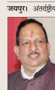
एक नई शुरुआत- एक नई पहल