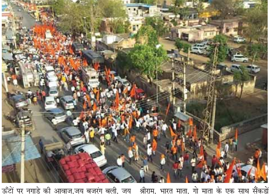
ऊंटों पर नगाड़े की आवाज, जय बजरंग बली, जय श्रीराम, भारत माता, गो माता के एक साथ सैंकड़ों

उदयपुरवाटी। कलियुग के देव बालाजी यानि शनिवार को हनुमान जयंती। कहा जाता है बालाजी तो ऐसे देव है जो शनिदेव को भी सबक सिखाये हुए हैं। ऐसे देव की जयंती पर घर-घर, देवरा-देवरा और मंदिर-मंदिर में हनुमान जयंती धूमधाम से मनाई गई। इसके लिए श्रद्धालु शुकवार से ही जागरण और जयंती पर सुंदरकांड पाठ, भजन कीर्तन कर और स्वाभंगी की प्रसादी कर बालाजी को पूरजोर श्रद्धा से पूरे क्षेत्र में रिझाने का प्रयास करते नजर आये। इसी क्रम में हनुमान जयंती के मौके पर शनिवार को 4 बजे बाद आदर्श बालिका उच्च माध्यमिक विद्यालय से हनुमान जी की विधिवत पूजा-अर्चना और तिलकाचर्चन के बाद, सैंकड़ों भगवा ध्वजों की पूजा कर उन्हें बजरंग दल, विश्व हिंदू परिषद और अगरएम्सएक के कार्यकर्ताओं और पदाधिकारियों ने हाथों में धाम सीधा कर हवा में लहराया और कतार बढ़ हो गए, उनके साथ रामदेवार, दुर्गामाता, झांसी की रानी लक्ष्मी बाई, भारतमाता, श्री कृष्ण भगवान और गो माता की मनमोहक और सुज्जित झांकियां