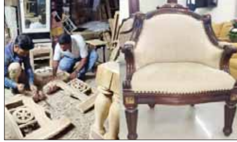
सिंह (शेर) की विशेषता वाली कुर्सी

बांसवाड़ा। प्रत्येक राज्य में राज्यपाल और मुख्यमंत्री के गार्ड ऑफ ऑनर से लेकर सुरक्षा तक खास कायदे होते हैं। ये बात हर आम आदमी जानता है, लेकिन राज्यपाल के बैठने वाली कुर्सी का भी प्रोटोकॉल होता है। इस बारे में बहुत ही कम लोग जानते होंगे। बांसवाड़ा में राज्यपाल कलराज मिश्र के लिए एक खास तरह की कुर्सी चर्चा में है, जो कि सात दिन में तैयार होगी। ये कुर्सी हूबहू राजभवन में रखी राज्यपाल की कुर्सी की जैसी होगी। जमीन से इसकी अधिकतम ऊंचाई 41 इंच होगी। बांसवाड़ा में राज्यपाल के लिए बन रही कुर्सी की जरूरत 24 अप्रैल को पड़ेगी। जब राज्यपाल मिश्र यहां राष्ट्रीय जनजाति स्काउट गाइड महोत्सव के मुख्य समारोह में हिस्सा लेंगे। इससे पहले 21 अप्रैल को धरु अशोक गहलोत कार्यक्रम का शुभारंभ करेंगे। कार्यक्रम में देश भर से 12 सौ से अधिक स्काउट गाइड हिस्सा लेंगे, जो जनजाति वर्ग के होंगे।