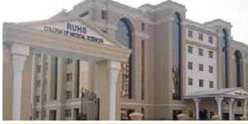
स्वीकृत पद प्रोफेसर 6, एसोसिएट प्रोफेसर 6, असिस्टेंट प्रोफेसर 6, जूनियर रजिस्ट्रार 12, मेडिकल सोशियल वर्कर 6, जूनियर असिस्टेंट 6, क्लास-4 8, माइक्रोबायोलॉजिस्ट 2, पब्लिक हेल्थ नर्स 2, पब्लिक हेल्थ इंजीनियर 1, एटोमोलॉजिस्ट 1, केमिकल एनालिस्ट 1, सैनिटरी इंस्पेक्टर 3, असिस्टेंट सेक्शन ऑफिसर 1, स्टेनोग्राफर 1, लैब टेक्नोलॉजियन 4, सॉनियर लेब टेक्नोलॉजियन 2

जयपुर। राजस्थान स्वास्थ्य विज्ञान विश्वविद्यालय परिसर में खुलने वाले पब्लिक हैल्थ कॉलेज खुलने की राह आसान हो गई है। सरकार ने पहले तो एनओसी जारी और अब भवन निर्माण के लिए 58.42 करोड़ रुपए और लैब टेक्नोलॉजीयन से लेकर प्रोफेसर के 69 पदों की स्वीकृति दी है। वर्ष 2022-23 में प्रथम चरण में राशि 4.30 करोड़ रुपए के आवश्यक उपकरण, छात्रों को लाने जाने के लिए बड़ी बस खरीदने की भी सहमति दे दी है। सत्र 2021-22 से मास्टर ऑफ पब्लिक हैल्थ (एमपीएच) कोर्स में 25 सीटों पर प्रवेश मिल सकेगा। मुख्यमंत्री अशोक गहलोत ने बजट घोषणा 2021-22 में राज्य में पब्लिक हैल्थ केयर डिजिटल सिस्टम को मजबूत बनाए रखने के लिए संभागीय स्तर पर पब्लिक हैल्थ कॉलेज खोले जाने की घोषणा की है। संस्थान में ऐसे कोर्स संचालित किए जाएंगे।