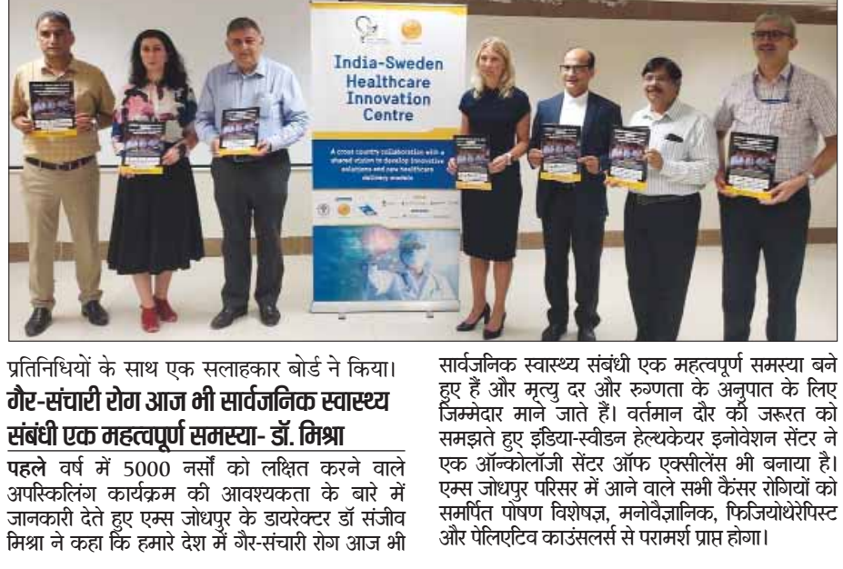
प्रतिनिधियों के साथ एक सलाहकार बोर्ड ने किया।

जोधपुर। स्वीडिश ट्रेड कमिश्नर ऑफिस, एम्स नई दिल्ली और एम्स जोधपुर के बीच साझेदारी के साथ गठित इंडिया-स्वीडन हेल्थकेयर इनोवेशन सेंटर ने 'स्किल फॉर स्केल' प्रोग्राम की शुरुआत की है। यह एक ऐसी ई-लर्निंग पहल है, जिसके माध्यम से नर्सिंग को व्यावहारिक ज्ञान से लैस करने की तैयारी की गई है, ताकि वे गैर-संचारी रोगों के प्रबंधन के लिए रोगियों की देखभाल से संबंधित नवीनतम तरीकों को अपना सकें। इससे देश भर के नर्सिंग को निःशुल्क पंजीकरण करने और अपनी सुविधा के अनुसार सीखने का अवसर मिलेगा। पहले चरण में डायबिटीज मैनेजमेंट, इस रोग की रोकथाम और इससे संबंधित जागरूकता पर ध्यान केंद्रित रहेगा। इस कार्यक्रम की सामग्री और मांड्यूल का निर्माण एम्स जोधपुर के विशेषज्ञों की टीम और एम्स दिल्ली, आईसीएमआर, स्वास्थ्य विज्ञान महानिदेशालय (डीजीएचएम), भारतीय नर्सिंग परिषद (आईएनसी) और एस्ट्राजेनेका के