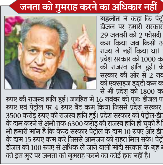
जनता को गुमराह करने का अधिकार नहीं

गहलोत ने कहा कि कोविड के दौरान सरकार ने 33 लाख परिवारों में प्रत्येक को 5500 रूपए की सहायता दी, जिस पर 1866 करोड़ का भार सरकार ने उठाया। अनाथ बच्चों को एक लाख रूपए तकल एव 18 वर्ष का होने पर पांच लाख की सहायता, 18 वर्ष की आयु तक 2500 रूपए पेंशन, 2000 रु. प्रति वर्ष स्कूल ड्रेस एवं किताबों के लिए दिए गए हैं। विधवा महिलाओं को एक लाख रु. तकल एव 1500 रूपए प्रतिमाह पेंशन तथा उनके बच्चों को 1000 रु. प्रतिमाह पेंशन दी जा रही है। विशेष पेंशन में 167 अनाथ बच्चों, 8049 विधवा महिलाओं एवं 5485 विधवा महिलाओं के बच्चों को सहायता जारी की गई है।