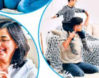
परिवार के साथ भरपूर आनंद लेती है। इस तरह बदला मौसम जीवन के प्रति और उमंग जगा देता है। साथ ही स्फूर्तिवान भी बनाता है।