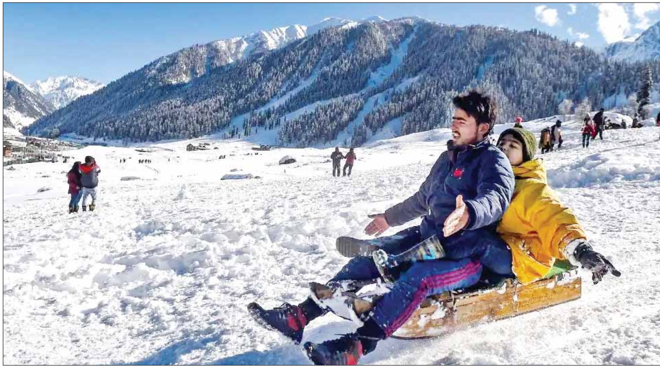
जागरूक जनता @ कश्मीर के सोनमर्ग में इन दिनों बर्फबारी हो रही है। बर्फबारी का लुफ्त उठाने के लिए यहां बड़ी संख्या में सैलानी भी पहुंचे हैं।

गहलोट ने सैनिकों के कल्याण के लिए किया अंशदान जागरूक जनता jagrukjanta.net