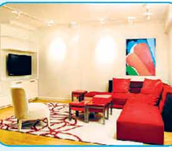
अगर आप घर के इंटीरियर को सर्दी के अकाउंटिंग में मरकरी करके रूठी हैं और उसे अट्रैक्टिव लुक भी देना चाहती हैं तो इसके लिए वार्म-ब्राइट कलर्स चूज करें। इन कलर्स में आप फर्नीचर और कर्टेस जैसे चीजें ले सकती हैं। घर को पेंट करने के लिए भी डार्क-वार्म शेड्स जैसे कॉफी कलर, ब्राइट रेड, ऑरेंज, यलो, फॉरेस्ट ग्रीन, डार्क पिंक या बरगंडी चूज कर सकती हैं। वैसे घर को ब्यूटीफुल टच देने के लिए वॉल पेपर्स या वॉल स्टिकर्स का यूज भी किया जा सकता है। यही कलर स्कीम फर्नीचर, कुशन कवर्स, सोफा कवर्स, बेडशीट, कर्टेस, रस, डोरमेट को भी दें। आप चाहें तो डार्क शेड में भी वैरिटी रख सकती हैं।