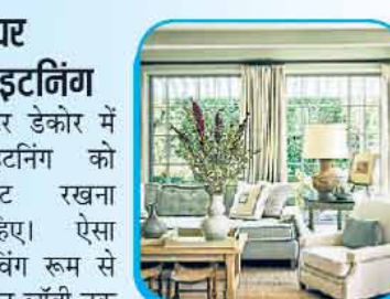
विंटर डेकोर में लाइटनिंग को ब्राइट रखना चाहिए। ऐसा लिविंग रूम से लेकर लॉबी तक में कर सकती हैं। दरअसल, इन दिनों अच्छी तेज धूप नहीं निकलती है, इसलिए घर में ब्राइट लाइटनिंग कर रोशनी बढ़ा सकती हैं। इसके लिए कमरे में फ्लोर लैंप लगावाएं और इसमें लो वॉट के बल्ब लगावाएं। सीलिंग लाइटनिंग भी मरकरी लाइट्स वाली करवाएं। लेकिन घर में बल्ब ऐसे लगावाएं, जिसमें बिजली की खपत कम हो, घर में रोशनी भरपूर हो।

प्रॉपर लाइटनिंग विंटर डेकोर में लाइटनिंग को ब्राइट रखना चाहिए। ऐसा लिविंग रूम से लेकर लॉबी तक में कर सकती हैं। दरअसल, इन दिनों अच्छी तेज धूप नहीं निकलती है, इसलिए घर में ब्राइट लाइटनिंग कर रोशनी बढ़ा सकती हैं। इसके लिए कमरे में फ्लोर लैंप लगावाएं और इसमें लो वॉट के बल्ब लगावाएं। सीलिंग लाइटनिंग भी मरकरी लाइट्स वाली करवाएं। लेकिन घर में बल्ब ऐसे लगावाएं, जिसमें बिजली की खपत कम हो, घर में रोशनी भरपूर हो।