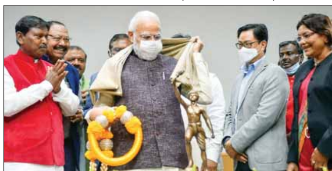
मंत्रिमंडल विस्तार बाद ली थी मंत्रियों की क्लास

चंडीगढ़ @ जागरूक जनता। दिल्ली बॉर्डर पर चल रहा किसान आंदोलन आज यानी बुधवार को खत्म हो सकता है। सिंधु बॉर्डर पर मंगलवार को हुई संयुक्त किसान मोर्चा की बैठक भी इसी मुद्दे पर हुई थी। अब केस वापसी को लेकर एक पंच फंस