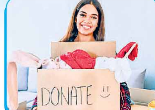
कंबल, गर्म कपड़ों का दान : कंबल या दूसरे गर्म कपड़े सर्द मौसम के बचाव के लिए बहुत जरूरी हैं। लेकिन कई लोगों के पास इन्हें खरीदने के लिए पैसे नहीं होते। ऐसे में आप खुद या किसी एनजीओ का सपोर्ट लेकर गर्म कपड़े या कंबल जरूरतमंद लोगों को दान कर सकती हैं। ऐसा करके आप कई लोगों को सर्दी की ठिठुरन से बचा सकती हैं।

गरीबों के बसेरों की मरम्मत : सर्द मौसम में यदि हमारे कमरे की खिड़की जग या खिली रह जाए तो ठंड से हम बुरी तरह ठिठुरने लगते हैं। जरा साँपिए, जिनके घर के छप्पर, दीवारें टूटी हों, उनके लिए यह समय कितना कठिन होता होगा। इसलिए अगर आप अपने इर्द-गिर्द ऐसे किसी जरूरतमंद या गरीबों को देखें तो जिनके बसेरें टूटे हैं तो उसकी मरम्मत करवा दें या आर्थिक मदद कर दें। इससे वे सर्द मौसम से अपना बचाव कर लेंगे। यकीनन जब आप ऐसा करेंगे तो आपको भी एक अनेखी खुशी मिलेगी।