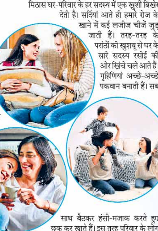
मिठास घर-परिवार के हर सदस्य में एक खुशी बिखरे देती है। सर्दियां आते ही हमारे रोज के खाने में कई लजीज चीजें जुड़ जाती हैं। तरह-तरह के परांतों की खुशबू से घर के सारे सदस्य रसोई की ओर खिंचे चले आते हैं। गृहिणियां अच्छे-अच्छे पकवान बनाती हैं। सब मिलकर तली हुई मटर का स्वाद जिंदगी का मजा बढ़ा देता है। इस तरह परिवार ही नहीं, आस-पड़ोस के साथ भी नजदीकियां बढ़ती हैं।

सर्दी अपने आप में एक खुशनुमा मौसम है। जाड़े की धूप जब घर के आंगन, मुंडेर और छत पर चांदी-सी बिखरती है, तब मन किसी अनजाने उत्साह-उमंग से सराबोर हो उठता है। कोहरे धरी ठंड से ठिठुरती जिंदगी को एक ऊर्जा मिलती है, हर कोई अपने काम में लग जाता है। इस मौसम का मिजाज कुछ ऐसा है कि लोग अपनी को करीब आते हैं, जिंदगी में कई नए और सकारात्मक बदलाव आते हैं। आप सर्दियों को आत्मसात करके इस मौसम का पूरा आनंद ले सकती हैं।