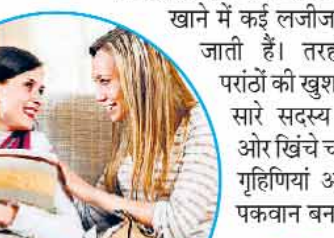
सर्दियों में दिन छोटे होने से घर, बाहर के सारे काम समय पर निपटाना महिलाओं के लिए एक चैलेंज होता है। वर्किंग वूमन के लिए तो दोहरे चैलेंज हैं। इसलिए महिलाएं अधिक एक्टिव होकर अपने घर-परिवार और ऑफिस से जुड़ी सारी जिम्मेदारियों को बखूबी निभाती हैं। आज की महिलाओं ने टाइम मैनेजमेंट करना बखूबी सीख लिया है। वे नौकरी करती हैं, बच्चों के साथ अपनी केयर भी। साथ ही छुट्टियां मिलते ही सर्दियों का आनंद लेने परिवार के साथ घूमने निकल जाती हैं। मौसम के मिजाज की हर खूबसूरती को जीने के लिए महिलाओं ने अपने शौक बदल लिए हैं। अब घर-गृहस्थी के काम के साथ वे ट्रेकिंग जैसे एडवेंचर स्पोर्ट्स करती हैं। मतलब यह कि सर्दियों का