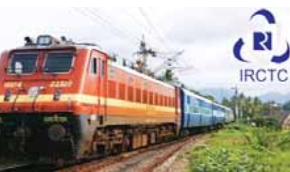
ये है श्री रामायण यात्रा का गणना मार्ग

जयपुर। भारतीय रेलवे खानपान एवं पर्यटन निगम यानी आईआरसीटीसी अब प्रभु श्री राम की राह पर चलने को तैयार है। इसके तहत प्रभु श्रीराम के दर्शन से जुड़े स्थलों के पर्यटन स्थलों के दौरान की योजना तैयार की गई है। इसके तहत अयोध्या से रामेश्वरम् तक तीर्थ स्थलों का भ्रमण कराई जाएगी। इसे 'श्री रामायण यात्रा' का नाम दिया गया है। इसके अंतर्गत नवंबर में मुरदुरे, पुणे, श्रीगंगानगर और अहमदाबाद से रवाना होंगी। इस दौरान भोजन, रहने की व्यवस्था, टूर गाइड एवं बसों द्वारा भ्रमण की व्यवस्था आईआरसीटीसी ही करेगी।