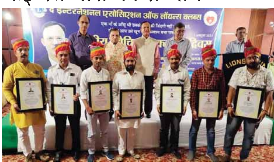
जागरूक जनता jagrukjanta.net