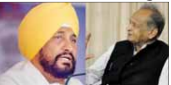
सियासी भोज से गलत मैसेज जाने के डर से दौरा रद्द

जयपुर। पंजाब के मुख्यमंत्री चरणजीत सिंह चन्नी का जयपुर दौरा रह हो गया है। स्वास्थ्य कारणों का हवाला देते हुए चन्नी ने दौरा रद्द किया है। इसके पीछे सियासी वजह को मुख्य कारण बताया जा रहा है। बताया जा रहा है कि लखीमपुरखीरी की घटना को देखते हुए पंजाब सीएम का दौरा रद्द हुआ है। चरणजीत सिंह चन्नी का 11 बजे जयपुर पहुंचने का कार्यक्रम था। चन्नी करीब सवा तीन घंटे जयपुर रुकने वाले थे। मंगलवार सुबह सामान्य प्रशासन विभाग को पंजाब सरकार की तरफ से मुख्यमंत्री चन्नी का जयपुर दौरा रद्द होने की सूचना दी गई। चन्नी के आगे जयपुर दौरे की भी कोई तारीख नहीं दी गई है। अचानक चन्नी का जयपुर दौरा रद्द करने की सियासी हलकों में चर्चाएं शुरू हो गई हैं।