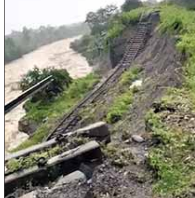
सीएम ने किया बाढ़ प्रभावित इलाकों का हवाई दौरा

लखनऊ । उत्तर प्रदेश में आगले साल होने वाले विधानसभा चुनाव में कांग्रेस 40% टिकट महिलाओं को देगी। पार्टी महासचिव प्रियंका गांधी ने मंगलवार को लखनऊ में प्रेस कॉन्फ्रेंस में यह बड़ा ऐलान किया। प्रियंका ने कहा कि यह फैसला तमाम पीड़ित महिलाओं के