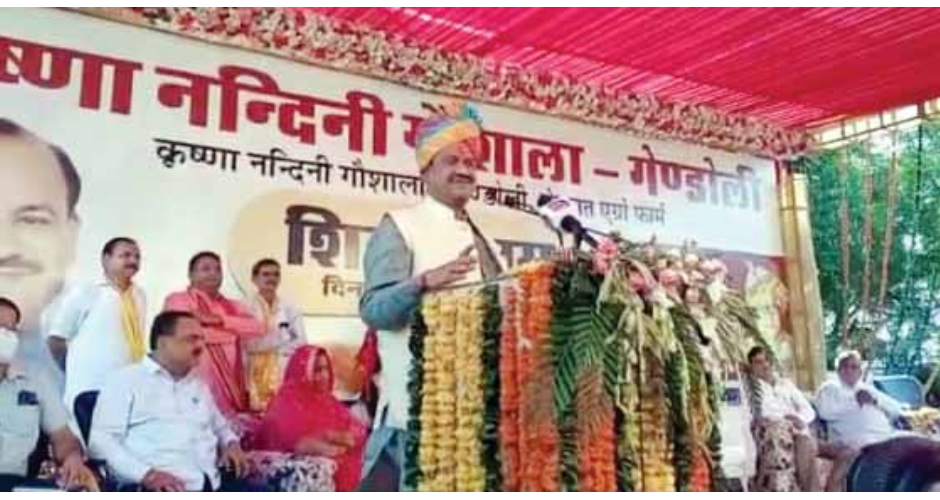
जनप्रतिनिधियों का अवगत कराएं। उनसे कार्यों की प्रगति का निरंतर फॉलोअप लें।

गऊशाला उद्घाटन के बाद लोकसभा अध्यक्ष ने द्वादश ज्योतिर्लिंग कंचन धाम में प्रबुद्धजन सम्मेलन को संबोधित किया। सम्मेलन में लोकसभा अध्यक्ष ओम बिड़ला ने कहा कि गांव के विकास की आवश्यकताएं जनप्रतिनिधियों से अधिक ग्रामीण समझते हैं। इसलिए यह आवश्यक है कि विकास कार्यों की प्राथमिकताएं भी नेता नहीं बल्कि ग्रामीण स्वयं तय करें। इसके लिए ग्रामीण क्षेत्रों में लोकतंत्र को और अधिक सशक्त बनाया जाना आवश्यक है। यह बात लोकसभा अध्यक्ष ओम बिड़ला ने प्रबुद्धजन सम्मेलन को संबोधित करते हुए कही। बिरला यहां गोण्डोली के निकट स्थित कंचनधाम सेवा संस्थान परिसर में आयोजित कार्यरत म को संबोधित कर रहे थे। उन्होंने कहा कि वे जिस भी ग्रामीण क्षेत्र में जाते हैं वहां लोग विकास कार्यों की आवश्यकताओं का आवेदन पत्र दे देते हैं। इनमें से अधिकतर आवेदन एक ही प्रकार के कार्यों के होते हैं। ऐसे में जनप्रतिनिधियों के लिए यह तय करना कठिन हो जाता है कि वे कौन से कार्यों को प्राथमिकता दें। उन्होंने कहा कि ऐसे में यह जरूरी है कि गांव के लोग बैठक में गांव के विकास की आवश्यकताओं की सूची बनाएं। फिर इस सूची में प्राथमिकता वाले कार्यों का आपसी विचार-विमर्श से निर्धारण कर