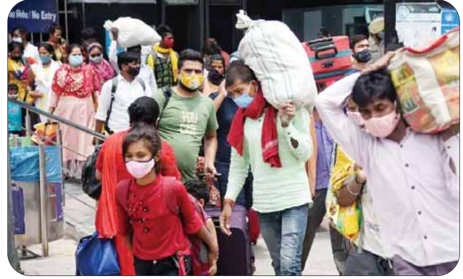
मुम्बई @ जागरूक जनता। लोकडाउन अनलॉक होने के साथ ही बाहरी राज्यों से लोगों की आवाजाही शुरू होने लगी है।