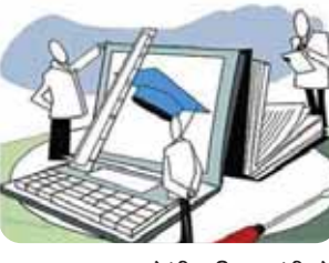
केंद्रीय शिक्षा मंत्री ने सोशल मीडिया पर दी जानकारी

जयपुर। सीबीएसई से सम्बद्ध स्कूल अब छात्रों के क्लास के अपने स्टूडेंट्स को कोडिंग और डेटा साइंस पढ़ाएगा। कोडिंग की क्लास छात्रों से आठवीं तक के स्टूडेंट्स के लिए होगी तो डेटा साइंस का कोर्स आठवीं से 12वीं के स्टूडेंट्स के लिए होगा। सीबीएसई ने यह कोर्स माइक्रोसॉफ्ट की मदद से बनाया गया है। इन विषयों को एकेडमिक ईयर 2021-2022 से स्किलिंग सर्विजेंट्स के रूप में पेश किया जाएगा।