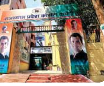
प्रधान, उप प्रधान और जिला परिषद सदस्यों को पहली प्राथमिकता

जयपुर। बीते ढाई साल से भी ज्यादा समय से राजनीतिक नियुक्तियों का इंतजार कर रहे कांग्रेस कार्यकर्ताओं और नेताओं का लंबा इंतजार अब खत्म होने वाला है। कोरोना संकट के बीच प्रदेश कांग्रेस जून माह के अंत तक प्रदेश में जिला और ब्लॉक लेवल पर 15 हजार से भी ज्यादा राजनीतिक नियुक्तियों का तोहफा देने जा रही है।