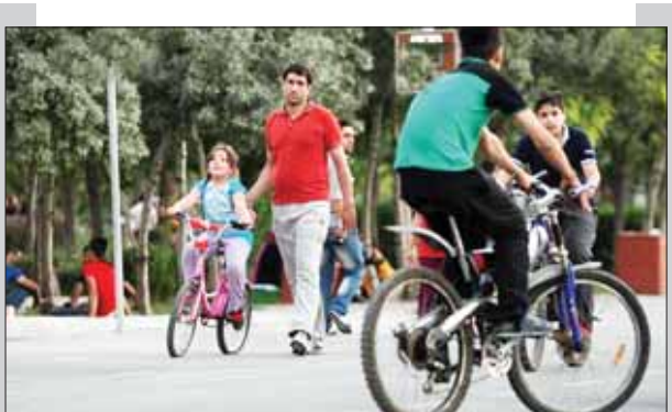
कुछ इस प्रकार हैं-

अगर हम कहें कि पिछले एक साल में भारत में साइकिलिंग के क्षेत्र में क्रांति आई है, तो शायद आपको यकीन नहीं होगा। लेकिन सच्चाई यही है और अगली पीढ़ियां पढ़कर आपको भी विश्वास हो जाएगा कि वाकई साइकिल के मामले में देश एक नई क्रांति ले रहा है। आज साइकिल को सुरक्षित और स्वस्थ व्यक्तिगत परिवहन माध्यम के एक महत्वपूर्ण साधन के रूप में देखा जा रहा है जो पर्यावरण को दुष्टि से टिकाऊ होने के साथ-साथ सुरक्षित दूरी भी सुनिश्चित करता है। हम सभी जानते हैं कि कोविड-19 महामारी देश भर में फैल रही थी, साइकिल चलाने वालों की संख्या में भारी वृद्धि देखी गई। लॉकडाउन प्रतिबंधों ने सार्वजनिक परिवहन का उपयोग करने वाले यात्रियों को काफी प्रभावित किया था, जिन्होंने साइकिल को छोटी और मध्यम दूरी के आवागमन के लिए एक व्यक्तिगत और कोविड-19 महामारी के दौरान सुरक्षित विकल्प के रूप में देखा था। इसके अलावा, साइकिल को अपने घरों तक सीमित रहने वाले लोगों द्वारा शारीरिक और मानसिक रूप से स्वस्थ रहने के साधन के रूप में भी देखा गया। इसी प्रेरणामय में पिछले साल 25 जून को केंद्रीय आवासन और शहरी कार्य मंत्रालय ने 'इंडिया साइकिल 4 चेंज' चुनौती की शुरुआत की। इस चुनौती के साथ 107 शहरों ने साइकिलिंग क्रांति का हिस्सा बनने के लिए पंजीकरण कराया और 41 शहरों ने सर्वेक्षण, चर्चा, साइकिल लेन को बनाना, सुरक्षित पड़ोस, चौड़ी सड़कों का निर्माण, साइकिल रैलियां, या ऑनलाइन अभियान की पहल शुरू की, जिसका उद्देश्य साइकिल के अनुकूल शहर बनाना था। विभिन्न शहरों ने लगभग 400 किलोमीटर मुख्य सड़कों और 3500 किलोमीटर से अधिक आस-पड़ोस की सड़कों को इस अभियान के हिस्से के रूप में शामिल करने का काम शुरू कर दिया है।