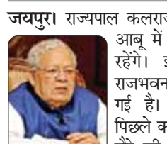
जयपुर। राज्यपाल कलराज मिश्र आज से माउंट आबू में ग्रीष्मकालीन प्रवास पर रहेंगे। इसके लिए वहां के राजभवन में पूरी तैयारियां कर ली गई हैं। पुलिस और प्रशासन पिछले कई दिनों से राज्यपाल के दौरे की तैयारियों में जुटा हुआ है। राज्यपाल मिश्र करीब एक सप्ताह तक माउंट आबू स्थित राजभवन में निवास

करेंगे। उनके साथ उनका परिवार भी गया हुआ है। राजस्थान में बरसों से यह परम्परा है कि राज्यपाल गर्मियों में कुछ दिन माउंट आबू चले जाते हैं। पिछले साल कोरोना के चलते राज्यपाल वहां नहीं गए थे। इस बार कोरोना का असर अब काफी कम हो गया है और इसी वजह से राज्यपाल सात दिन तक वहां रुकेंगे और राजभवन का काम वहां से होगा। जरूरी फाइलें भी वहां के राजभवन में पहुंचा दी गई हैं। राज्यपाल कलराज मिश्र अब यहीं से फाइलों को निपटाने का काम करेंगे। सभी अधिकारियों को इसके लिए निर्देश भी दे दिए गए हैं।