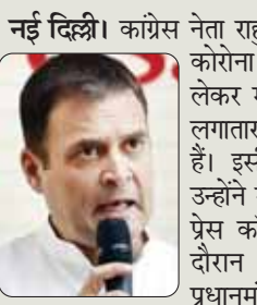
नई दिल्ली। कांग्रेस नेता राहुल गांधी देश में कोरोना के हालात को लेकर मोदी सरकार पर लगातार हमलावर रहे हैं। इसी सिलसिले में उन्होंने मंगलवार को भी प्रेस कॉन्फ्रेंस की। इस दौरान राहुल ने प्रधानमंत्री नरेंद्र मोदी पर सीधा हमला बोलते हुए कहा कि कोरोना की