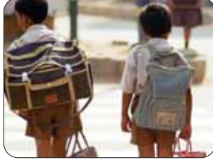
कराई जाएगी। इसको लेकर पॉलिसी अब तैयार होगी।