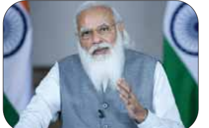
जागरूक जनता नेटवर्क jagrukjanta.net

आने वाली चुनौतियों के लिए तैयार रहना होगा