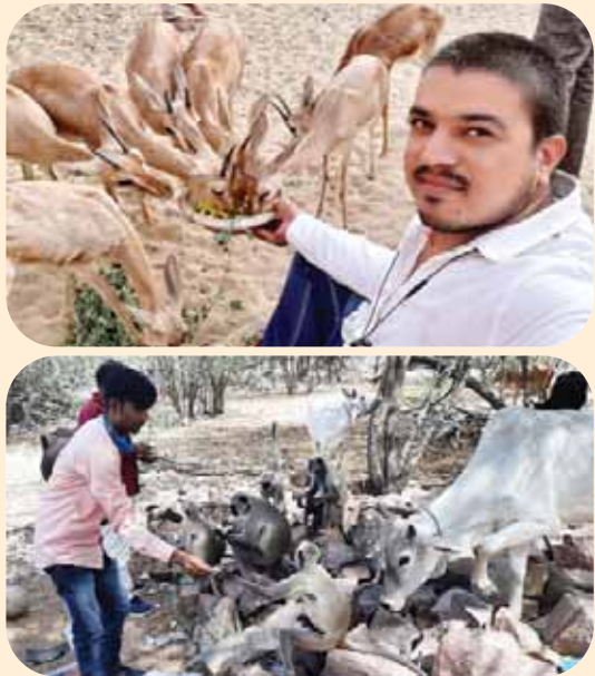
जागरूक जनता नेटवर्क jagrukjanta.net

जागरूक जनता के अभियान की शहरी व ग्रामीण क्षेत्र में लोगों ने की सराहना