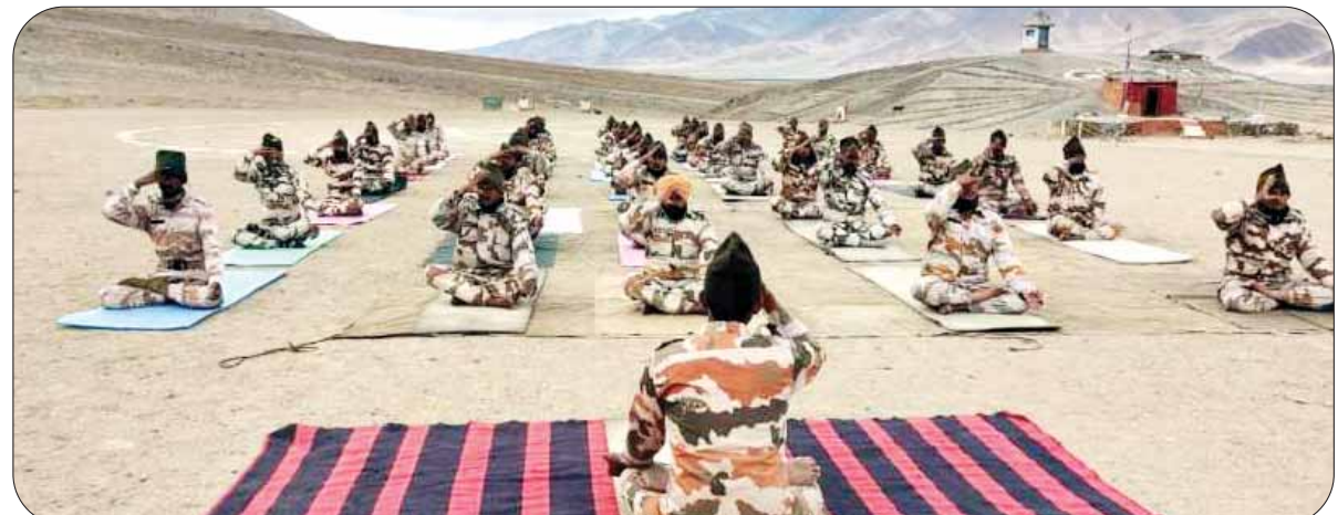
जागुरूक जनता @ अन्तरराष्ट्रीय योग दिवस पर ITBP के जवानों ने लद्दाख में बॉर्डर आउट पोस्ट के पास 15,000 फीट की ऊंचाई पर योग किया। 21 जून के दिन की एक खासियत है कि यह वर्ष के 365 दिन में सबसे लंबा दिन होता है और योग के निरंतर अभ्यास से व्यक्ति को लंबा जीवन मिलता है इसलिए इस दिन को योग दिवस के रूप में मनाने का निर्णय किया गया।

नुकसान होता है तो उनके खिलाफ कार्रवाई की जाएगी। हालांकि सिंह ने कहा कि अभी तक प्रदेश के किसी प्रमुख नेता ने ऐसा कोई विवादित बयान नहीं दिया है। सिंह ने पत्रकार बार्ता में कहा कि मैंने प्रदेश नेतृत्व को कहा है कि बहुत हो चुका है। ऐसे नेताओं की सूची बनाओ जो बयानबाजी कर रहे हैं। ऐसे नेताओं को समझाएंगे और नहीं माने तो कार्रवाई की जाएगी।