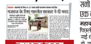
जागरूक जनता नेटवर्क jagrukjanta.net