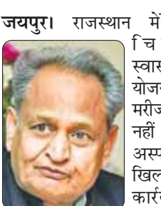
जयपुर। राजस्थान में मुख्यमंत्री चिरंजीवी स्वास्थ्य बीमा योजना के तहत मरीजों का उपचार नहीं करने वाले अस्पतालों के खिलाफ कड़ी कार्रवाई की जाेगी।

यथासंभव एक दिन में और ज्यादा या ज्यादा तीन दिन में किसी पीडित मरीज की शिकायत का समाधान किया