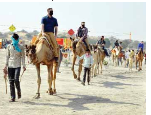
जागरूक जनता नेटवर्क jagrukjanta.in/com

जमे रहे। आला अधिकारियों ने पहले भारतीय जवानों को इशारा किया कि वो नाच सकते हैं। मौका मिलने के बाद कौन चूकने वाला था। कई जवान मुख्य मंच पर आए और पंजाबी गीतों पर झूम उठे। पिछले कुछ दिनों में ही दोस्त बने अमेरिकी जवानों को भी भारतीय जवानों ने भी अपनी तरफ खींच लिया। धुन ही ऐसी थी कि कोई खुद को रोक न सका। भले ही डांस के स्टेप उन्हें ठीक से समझ नहीं आ रहे थे लेकिन मस्ती के साथ नाचने में किसी अमेरिकी जवान ने कोई कसर नहीं छोड़ी।