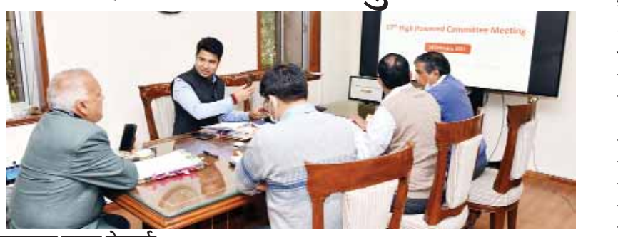
जागरूक जनता नेटवर्क jagrukjanta.net/com

जयपुर। मुख्य सचिव निरंजन आर्य ने शहर में संचालित पशु डेयरियों को जल्द से जल्द शहर से बाहर शिफ्ट करने के अधिकारियों को सख्त निर्देश दिए। उन्होंने कहा कि शहर में आवारा पशुओं के कारण दुर्घटनाएं हो रही हैं। सुप्रीम कोर्ट ने भी शहर में संचालित डेयरियों को शहर से बाहर शिफ्ट करने का आदेश दिया हुआ है। इसलिए इस मामले पर जल्द से जल्द कार्यवाही की जाए। आर्य ने यह बात मंगलवार को शासन सचिवालय में आयोजित जयपुर सौन्दर्यीकरण के लिए गठित हाई पावर्ड कमिटी की बैठक में कही। मुख्य सचिव ने कहा कि जयपुर का सौन्दर्यीकरण प्रदेश सरकार की प्राथमिकता में है। साथ ही उन्होंने स्वच्छता से संबंधित कार्यों में तेजी लाने के निर्देश भी दिए। उन्होंने कहा कि शहर की स्वच्छता एवं सौंदर्यकरण के लिए हम सभी को पर्सनल कमिटेन्ट के साथ कार्य करना होगा। उन्होंने कहा कि इसके लिए धन की कमी नहीं आने दी जायेगी। बैठक में ट्रेफिक मैनेजमेन्ट, एक्सिडेंट जोन और पार्किंग व्यवस्था पर चर्चा करते हुए मुख्य सचिव ने रात्रि में ट्रेफिक सिग्नल को लेकर पुलिस विभाग को निर्देश दिए कि रात के समय में ट्रेफिक सिग्नल की वैकल्पिक व्यवस्था हो ताकि रात्रि में होने वाली दुर्घटनाओं पर रोक लग सके। बैठक में नगरीय विकास विभाग के प्रमुख शासन सचिव भास्कर ए सावंत, जयपुर विकास प्राधिकरण आयुक्त गौरव गोयल भी उपस्थित रहे। बैठक में विनार के माध्यम से परिवहन आयुक्त रवि जैन, जयपुर नगर निगम (ग्रेटर) यशमित्र सिंह देव, जयपुर नगर निगम (हैरिटेज) लोकबन्धु, बिजली एवं पुलिस विभाग के वरिष्ठ अधिकारियों सहित जागृति एवं मुस्कान एनजीओ के प्रतिनिधियों ने भाग लिया।