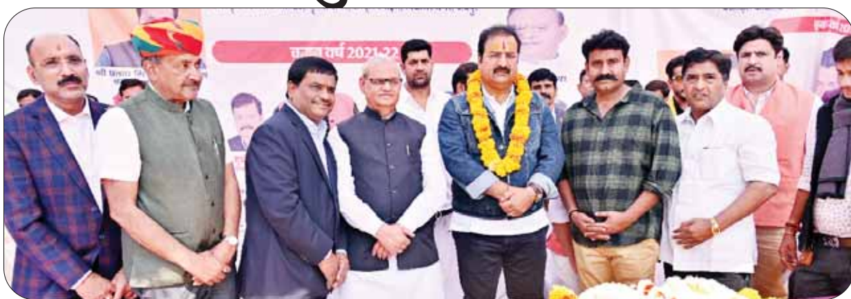
जागरूक जनता नेटवर्क jagrukjanta.net