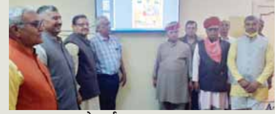
जागरूक जनता नेटवर्क jagrukjanta.in/com

विद्या भारती की मासिक ई पत्रिका का विमोचन