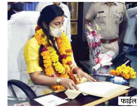
नाश्ते-फूल का खर्च विकास कार्यों पर होगा खर्च

क्यांकि: निगम के घाटे से जनता के छोटे-छोटे काम रुक रहे तो फिर अफसर भी खुशबू क्यों लें यहां भी कंजूसी: मेयर के चैंबर में नाश्ते के दौर नहीं चलेंगे, पानी की बोतल की जगह कैंपर जागरूक जनता नेटवर्क jagrukjanta.net/com