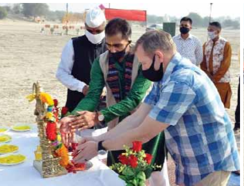
जागरूक जनता नेटवर्क jagrukjanta.in/com

फायरिंग रेंज के मैदान पर बसंत पंचमी पर दो घंटे का कार्यक्रम रखा गया था। इस दौरान सबसे पहले भारतीय जवानों ने अमेरिकी अफसरों को बसंत ऋतु और बसंत पंचमी के बारे में जानकारी दी। इसके बाद राजस्थानी धोरे में पंजाबी गीत भी शुरू हो गए। म्यूजिक सिस्टम चालू होने के बाद भी जवान अपनी पोजिशन पर