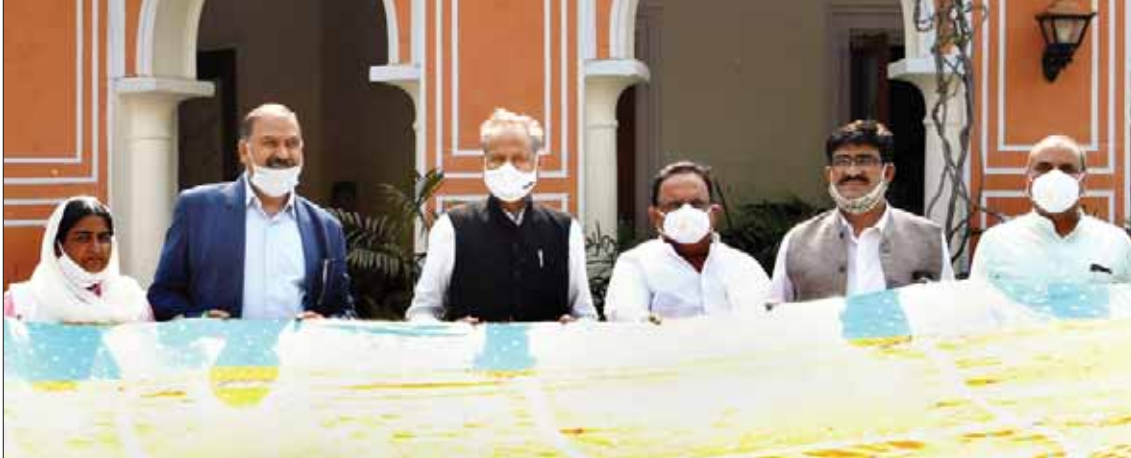
जागरूक जनता नेटवर्क jagrukjanta.in/com

आम दिनों में अमेरिकी सेना का टैंक स्ट्राइकर दौड़ाने वाले जवानों ने महाजन फोल्ड फायरिंग रेंज में मंगलवार को ऊंटगाड़ी पर बैठे लगाए। इस दौरान ऊंट गाड़ी के जानकार साथ रहे तो हाकने में अमेरिकी जवानों ने भी पूरा सहयोग दिया।